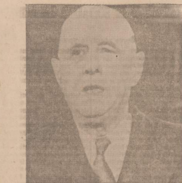
Prancūzijos prezidentas Charles De Gaulle Elysee rūmuose rekorduoja savo kalbą, kuri vėliau buvo transliuojama per radiją ir televiziją.