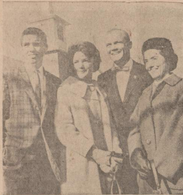
Astronautas John Glenn su savo žmona ir dviem vaikais prie Little Falls presbiterionų bažnyčios. Numatoma, kad šio mėnesio 13 d. jis bus raketos pagalba išsautas į erdvę.

Reikia dar pridurti, jog vaikučiams premjeros vaidinimas, matyt, taip patiko, jog jų gerieji tėveliai turėjo juos atvesti ir į sekmdienio vaidinimą. Taigi šiuo pastatymu Scenos darbuotojų s-ga bus taikliai pataikiusi į mūsų publikos nuotai-kas. Beje, negavę bilietų ir traukdami nuo kasos "pavėlavusieji" lyg sugestijonodami kalbėjosi: gal tai nebus paskutinis vaidinimas... Kadangi taip gražiai viskas vyko ir pavyko, tai gal nebus pro šalį čia išvardijus visus tuos asmenis, kurie tame pastatyme dalyvavo ir pasitarnavo.