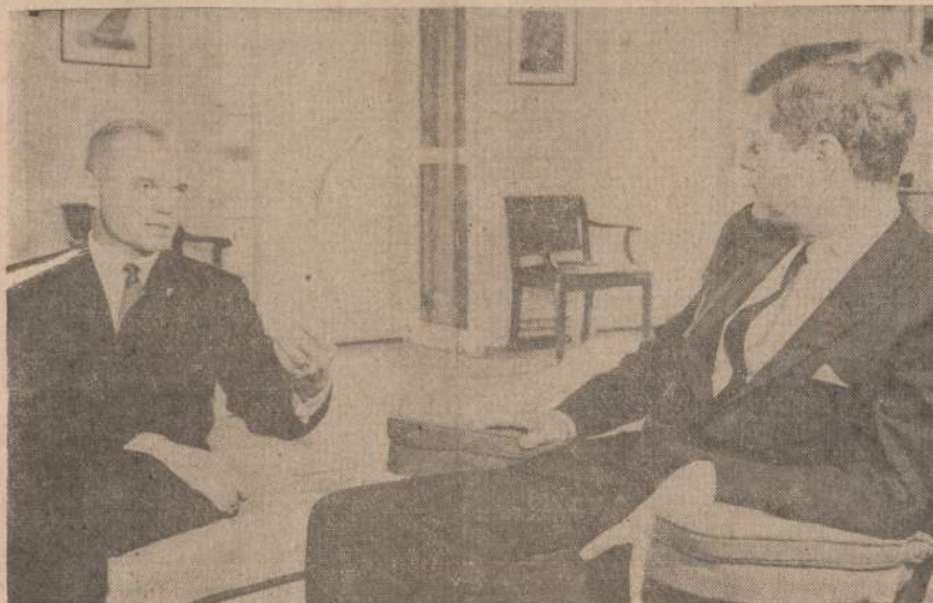
Prezidentas Kennedy priėmė savo kabinete pulk. John H. Glenn, kuris yra parinktas skristi raketa aplink žemę.

Lenkijos žemės ūkio gamyba pernai padidėjo, kada ji nukrito ne tik Rytų Vokietijoje, bet ir Čekoslovakijoje, Vengrijoje, jau nekalbant Kinijoje, kur žemės ūkio komunos privedė pre bado.