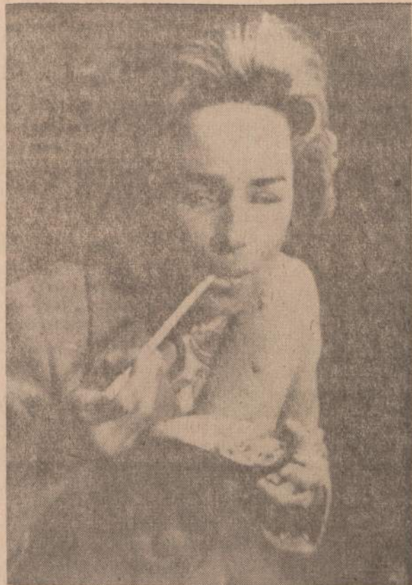
Robert F. Kennedžio žmona Tokijo restorane (Japonijoje) bando valgyti pagaliukais. Jos vyras yra JAV vyr. prokuroras. Jis kartu su žmona lanko įvairius kraštus kaip geros valios ambasadorius.

Senstant fizinė sveikata daugelyje atvejų silpnėja, bet supratimas, intelektualinės jėgos ir vaizduotė gali ir nesilpnėti. Fizinį jėgų silpnėjimą dar nereiškia kūrybinių funkcijų išsiskėmimo. Garsusis romėnas Kato (Cato) pradėjo mokytis graikų kalbos, sulaukęs 80 metų. Goethe baigė rašyti "Faustą" tam žavingam Weimaro mieste, turėdamas 82 metus. 98 metų amžiaus Tietjanas dar galėjo sukurti gražiausius paveikslus. 87 metų Toscanini dirigavo simfoninius koncertus. Paderevskis, Kreisleris ir kai kurie kiti muzikai dar žavėjo savo klausytojus, sulaukę gilos senatvės. Amerikietis išradėjas Edisonsas, eidamas 83 metus, dar darbovo savo laboratorijoje, o 81 metų Benjaminas Franklinas padėjo sudaryti JAV konstituciją. Mūsų laikais Churchill ir Adenaueris, abudu turintieji per 80 m., dar savo patyrimais iš ilgo gyvenimo tebegebėsti savo šalim. Dauguma, nors ir ne visi, senstantieji žmonės pasidarą ramesni, — tarytum, kaip ir aptyla vėtra jūroje, mažėja noras viską reformuoti, daugiau rūpi mąstyti, gilintis, svarsty-