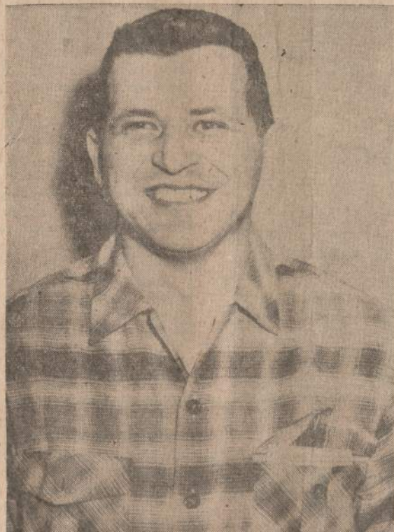
U-2 lakūnas Francis Gary Powers, ką tik iškeistas su Sovietų Rusija į jos šnipą, pulk. Abelį. Powers nuotrauka padaryta 3 valandas po atskridimo į Jungtines Valstybes.

LONDONAS. — 13 metų princas Charles, Anglijos sosto įpėdinis, buvo skubiai nugabentas sekmadienį į ligoninę, kur jam padarė apendicito operaciją. Operacija pasisekusi ir princas netrukus grįš į savo privačią mokyklą Cheam priemiesty, 50 mylių nuo Londono.