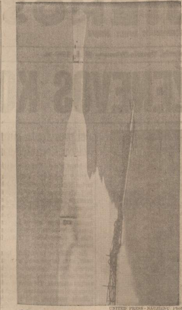
Is Cape Canaveral (Fla.) buvo išlaistas Tiro satelitas, kurio tikslas yra teikti meteorologinę informaciją. Tai jau ketvirtas tos rūšies satelitas.

Taigi Tito, Nehru, Sukarno, Nkrumah, Nasseris ir kiti panašūs Kremliaus ponų padlaižiai bei šlužai. Juk jie nėra Amerikos draugai, savo nedraugiškumą Amerikai jie kartkartėmis pademonstravo visokių balsavimų tarptautiniame forume. Tai kamgi remti savo priešus? Kogi tas JAV ambasadorius Kennan taip skuba iš Jugoslavijos į State Departmentą su protekcija ir advokatauja piliti Titui į jo kiurą komunistinį maišą dar milijonus ir milijonus dolerių, kurių Jugoslavijos žmonės juk visai nemato, jie eina Tito komunistinėms pozicijoms stiprinti. Girdi, Tito kitoks komunistas, negu Kremliaus bolševikai. Gal jo raudona spalva kiek ir kitokio atspalvio, bet ji ryškiai raudona ir nėra reikalo ją matuoti per kažkokį spektroskopą. Bet svarbiausia, kad jis