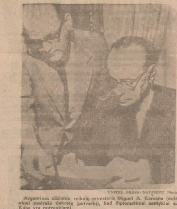
Argentinijos užsienio reikalų ministras Miguel A. Carcano (dešinėje) pasirašo dekretą (potvarkį), kad diplomatiniai santykiai su Kuba yra nutraukiami.