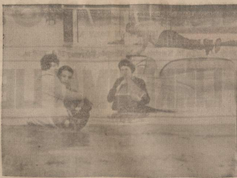
Los Angeles studentai apleidžia savo potvynio apsemą automobilį. Los Angeles ir pietinę Kalifornijos dalį iškilo didžiausia liūtis, kurios pasekoje įvyko vienas didžiausių potvynių Kalifornijos istorijoje. Daugelis buvo priversti apieisti savo namus. Be to, kiek žinoma, vienas asmuo žuvo.