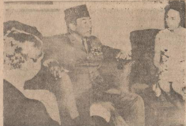
JAV vyriausias prokuroras Robert Kennedy (kairėje) su žmona apsilankė pas Indonezijos prezidentą Sukarno, su kuriuo turėjo "neformalų" pasitarimą dėl Indonezijos ir Olandijos ginčo.