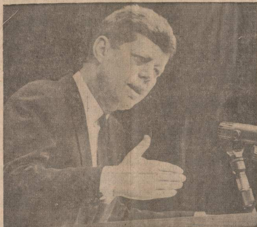
JAV PREZIDENTAS JOHN F. KENNEDY, priėmęs Amerikos lietuvių delegaciją vasario 16 diena, minint Lietuvos nepriklausomybės paskelbimo 44-tą sukaktį.