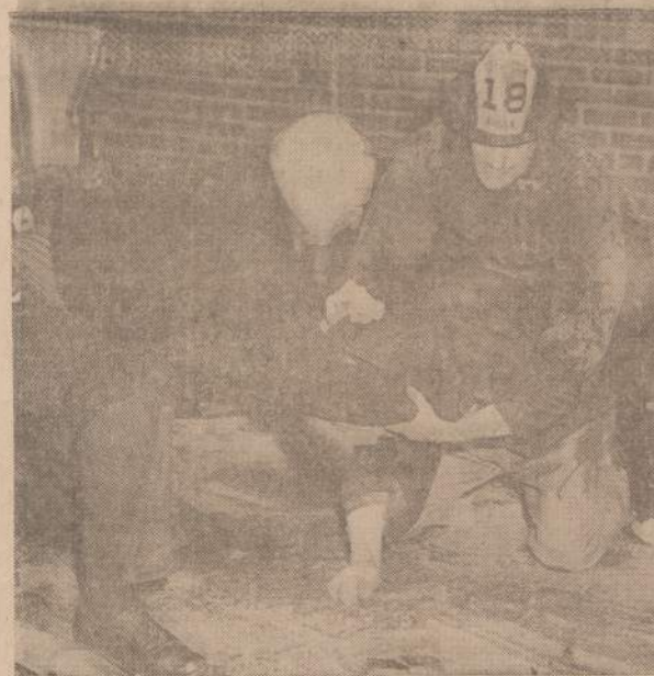
Čiengos gaisrininkai kartais turi kovoti ne vien su ugnimi, bet ir su agresyviais žiurvais. Vaizde du gaisrininkai "gesina" kažkio stebėtojo temperamanta, kurs ne vien liežuviu, bet ir veiksmu bandė įveikti jam nepatinkamus gaisrininkus.

Skaitlytas laiškas iš Čiengos Lietuvos Tarybos, kviečiantis dalyvauti Vasario 18 dieną Lietuvos Nepriklausomybės minėjime ir prisidėti su anka Lietuvos laisvinimo darbais.