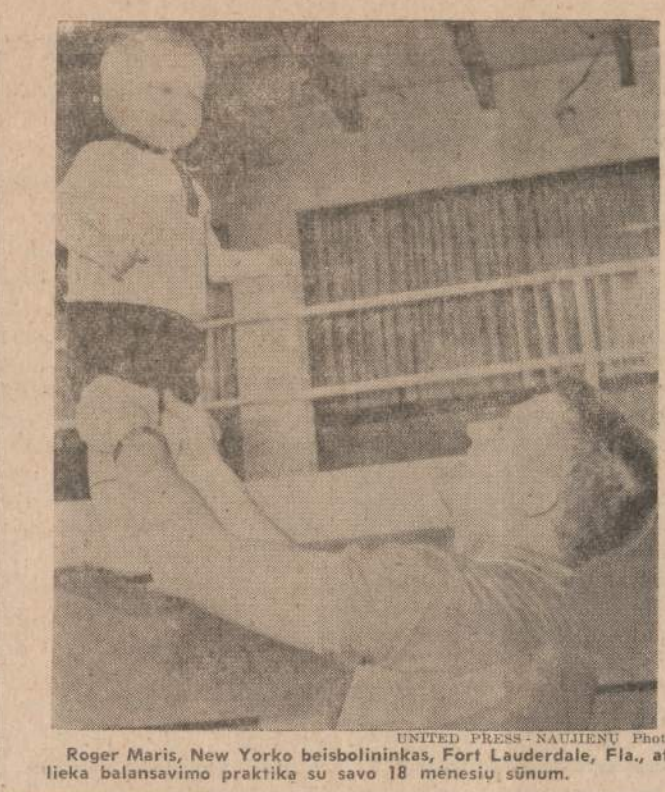
Roger Maris, New Yorko beisbolininkas, Fort Lauderdale, Fla., atlieka balansavimo praktiką su savo 18 mėnesių sūnum.