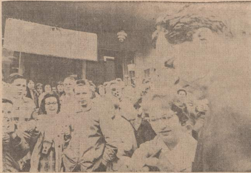
Buves viceprezidentas Richard Nixon, pradėdamas kampaniją kaip respublikonų kandidatas į Kalifornijos gubernatorių, kalbėdamas Sonora miestelyje, pasisakė duosias "dinamiška vadovybe", jei busias išrinktas ateinančių rudenį.

nei jo draugiški jausmai Guagniniui, nei visiškai pasitikėjimas juo nepasikeitė. O Guagninis?