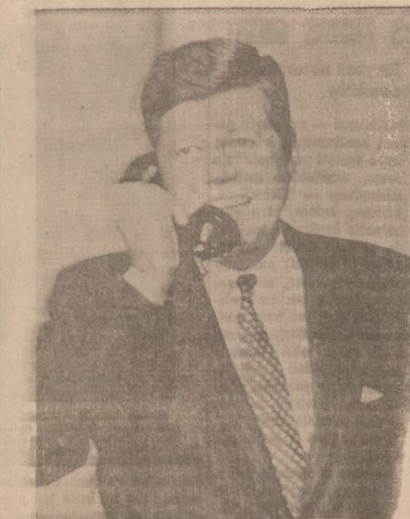
Prezidentas Kennedy kalbasi telefonu su Cape Canaveral informacijos karininku po to, kai pulk. Glenn buvo raketėje išleistas orbiton ir apskrido aplink žemę.

Aną dieną "Naujienuos" išreiškė pageidavimą, kad kelti ginčus dėl to, kas atsitiko prieš delegacijos priėmimą Baltajame Name, nebėra prasmės. Vietoje to, "N." ragino mūsų veikėjus linkamai tą įvykį įvertinti, kaip reikšmingą laimėjimą mūsų kovoje dėl Lietuvos laisvės. Mūsų kova turi būti nukreipta prieš Lietuvos pavergėjus, o ne lietuvių prieš lietuvius.