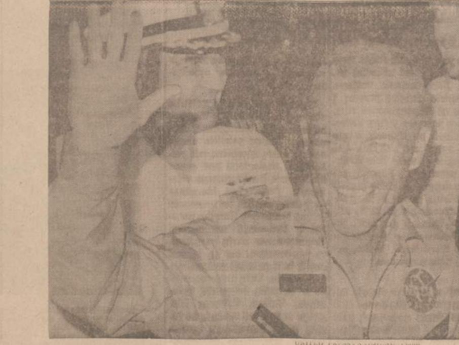
Pirmasis amerikietis per 4 valandas tris kartus apskridęs žemės kamuoliu, karo laivu Goa atvežamas į JAV lėktuvneį Randolph. Vėliau buvo nugabentas į Grand Turk salą sveikatai patikrinti.

Berlyne 427 savižudžiai Vienas Vakarų Berlyno laikraštis pranešė, kad 1961 m. tarp gruodžio 23 ir 31 d. sovietiniame Berlyno sektoriuje nusizūdė nemažiau kaip 427 žmonės. Iš jų daugumas sau gyvybę atėmė naktį iš gruodžio 24 į 25 d. (PL)