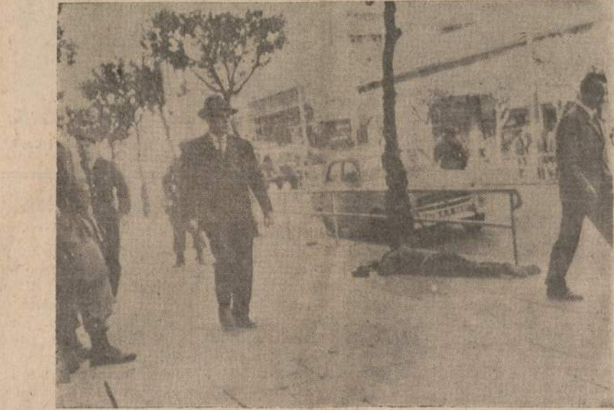
Teroras Alžire paskutinėmis dienomis pasiekė to, kad teroristai suėmė žmones net turėdama aiškų teise. Vien Alžire baltieji teroristai nužudė 18 ir suėmė 11 arabų.