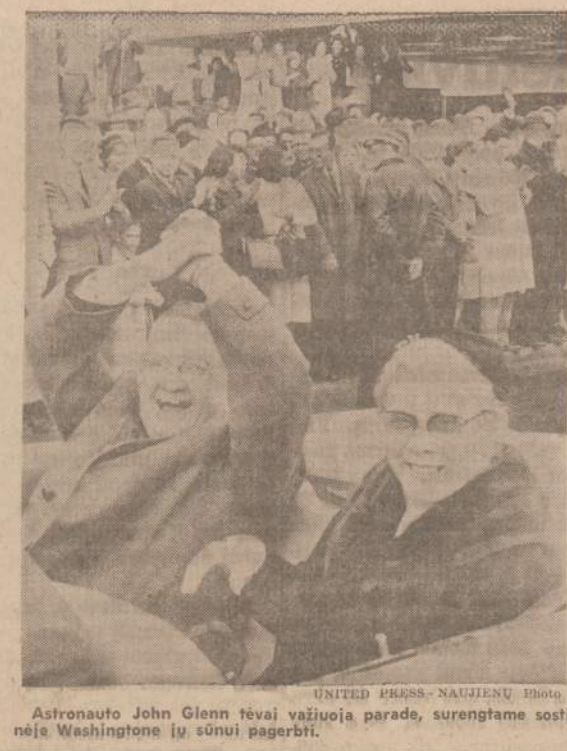
Astronaut John Glenn tėvai vaičiuoja parade, surengtame sostinėje Washingtone jų sūnui pagerbti.

Tai labai mažas skirtumas. Žinoma, iki lapkričio, balsuotojų nuotaiškos gali pakrypti į vieną arba antrą pusę. Bet tie 8 nuoš. balsuotojų, kurie šiandien dar nėra apsi-