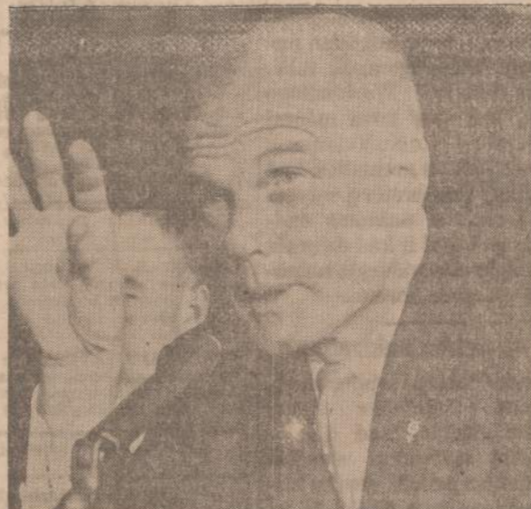
Astronautas John Glenn kalbėjo Senato erdvės ir aeronautikos komitete. Savo kalboje jis pareiškė, jog jaunuoliai, kurie nori įjungti į vykdomą erdvės programą, turi visapusiškai apsišviesti.