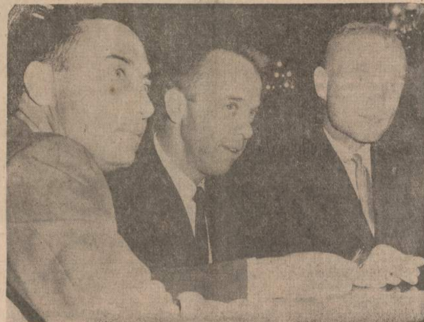
Trys Amerikos astronautai, kurie buvo apklausinėjami Kongreso erdvės ir aeronautikos komiteto. Jie — Virgil Grissom, Alan Shepard ir John Glenn — pareiškė, jog negalima tikėtis, kad ateityje visi Amerikos astronautai bus taip laimingi, kaip jie. Vadinas, galima laukti ir nespesikimų.

LONDONAS. — Antony Armstrong-Jones, iš profesijos fotografas, buvo paskirtas lordų rūmų nariu ir pasakė trečią dieną pirmą ir, tur būt, paskutinę "politinę" kalbą. Kadangi jis pasidarė anglų karalienės sesers vyrų, jis buvo pakeltas į lordus, pavadintas baronu Snowdon. Lordų rūmuose yra 204 nariai, iš kurių Antony yra pats jauniausias.