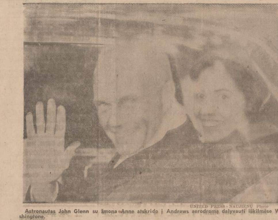
Astronautas John Glenn su žmona Anne atskrido į Andrews aerodromą dalyvaui iškilimėse Washingtono.

SKAITYK PATS IR PARAGINK KITUS SKAITYTI NAUJIENAS JOS VISAD RAŠO TEISYBE PIRKITE JAV TAUPYMO BONUS