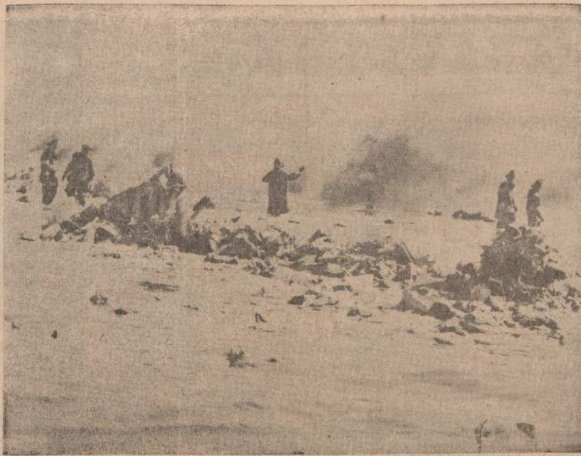
Iš New Yorko Idlewild aerodromo vos pakilęs 707 sprausminis lėktuvas nukrito ir sudėgė. Žuvo visi 95 asmenys. Nuotraukoje parodomi gaisrininkai, iešką lėktuvo lauzė žuvusių aukų.

— Griežtai kritikai pareikšti nereikia drąsos, — tereikia tik iš anksto susirasti naują darbavietę, kur galėtum pris-