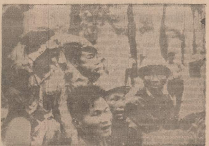
Po dviejų laktuvų prezidento Dieno Romy užpuolimo Saigone (Vietname), sužaloti ir stengiasi išgyti "džypa".

Veiklos sekmė, aišku, pirmiausia priklausys nuo to, kiek lietuvių protestantų studentija bus asmeniška ir visuomeniškai subrendusi, kiek ji turės pagarbos bei tolerancijos sau ir savo artimui, kiek spręsdama visuomeninius reikalus, pajėgs suvaldyti savo asmeninę tendenciją, ir, žinoma, kiek ji savos veiklos užsimojimus bus supratusi.