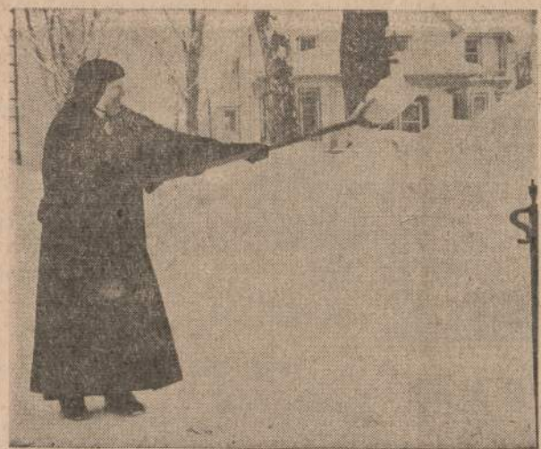
Ant Iron Mountain (Geležies kalno), Michigan valstijoje, riek iškritę sniego, jog sniego valymo įrankiai nebepajėgė daugiau veikti ir sugedo.