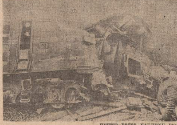
Pennsylvanijos geležinkelio keleivinis traukinys susidūrė su prekinio traukiniu apie 23 mylias nuo Lewisstown, Pa. Keleivinis traukinys ėjo iš New Yorko į Chicago. Iš viso juo važiuo 121 asmuo, iš kurių dvylika buvo sužeisti.

Valandos: Kasdien nuo 9 ryto iki 4:30 po pietų. Ketvirtadieniais nuo 9 ryto iki 8 val. vakaro. Trečiadieniais uždaryta.