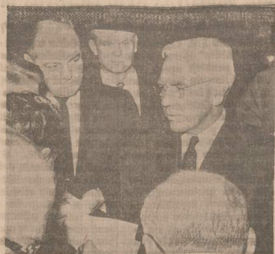
John A. McCone, JAV žvalgybos viršininkas (dešinėje), kalbasi su spaudos atstovais. Jis pareiškė, jog Francis Powers, kuris Rusijoje buvo suimtas jo tėkturvi nukritus, nenusidėjo Amerikos valdžiai.