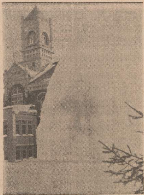
Ledo medis Gaylord (Mich.) aikštėje prie teismo rūmų. Šią žiemą tas medis "išaugo" iki 35 pėdų.

— Lietuvos opera, kuriai ir jūs duodate taiklų pavadinimą, nežiūrint okupanto pastangų, ir savo tradicijomis ir savo tikslais didžiąja dalimi tebėra Lietuvos opera. Naujusius Metus iki šiolieji ji tebesutinka "Traviatos" pastatymu, lig ir įrodydama tą norą tarnauti menui, grožiui ir žmogiškumui. Publika taip pat jautri meno žmogaus pastangoms, kaip jau-