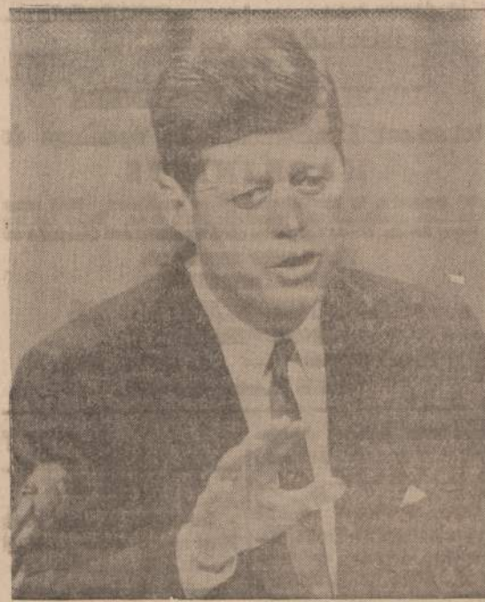
Prez. Kennedy antradienį pasiuntė atsakymą Chruščiovui, paprašydamas baigti propagandines šnekas ir pradėti rimtas derybas apie atominį bombų bandymų uždraudimą.

1961 m. palyginus su 1960 metais grūdinių kultūrų derlius sovietuose pakilo vos 2,4 %, bet pristatymai valstybei pakelti net 12% ir jie pakilo nuo 16,7 iki 52,1 mil. tonų.