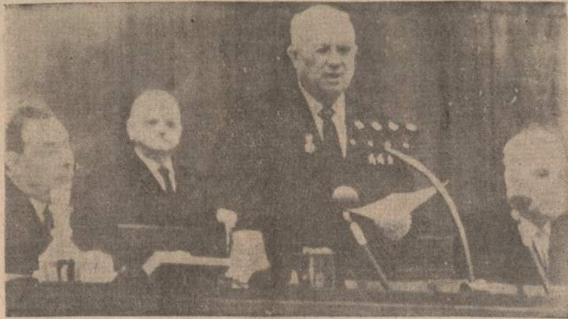
Sovietų premjeras Nikita Chruščiovas sako kalbą komunistų partijos centro komiteto susirinkime, Kremliuje. Pačioje kairėje yra Sovietų prezidentas Leonid Brežnev, o dešinėje — premjero pavaduotojas Frol Kozlov.