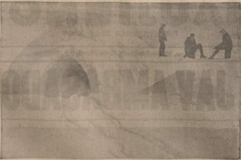
Michigan ežero žuvalotai žiemos metu naudojami visokiomis stieptuvėmis, kad galėtų apsiginti nuo šalčio. Tačiau čia matoma stieptuvė, pastatyta ant Houghton ežero ledo, yra originaliausia. Ji padaryta eskimų "igloo" (ledo ir sniego namelio) pavyzdžiu.

Vėliau tas pats Rask studijavo gyvas kalbas Suomijoje, St. Peterburgo srityje, Maskvos universitete. Iš ten jis pateko į Astrachanų bei Tiflisą. Vėliau persikėlė į Persiją ir Indiją. Pasiekė Ceilono salą, su šventaisiais budistų raštais, lygino jų kalbas ir rašė knygas. Jis labai daug prisidėjo prie visos eilės babiloniškų plytelių išaiškinimo. Tas Egipto kalbų ir senovės daktaras man pripasakojo labai daug dalykų apie tą mano protėvį. Savo lai-