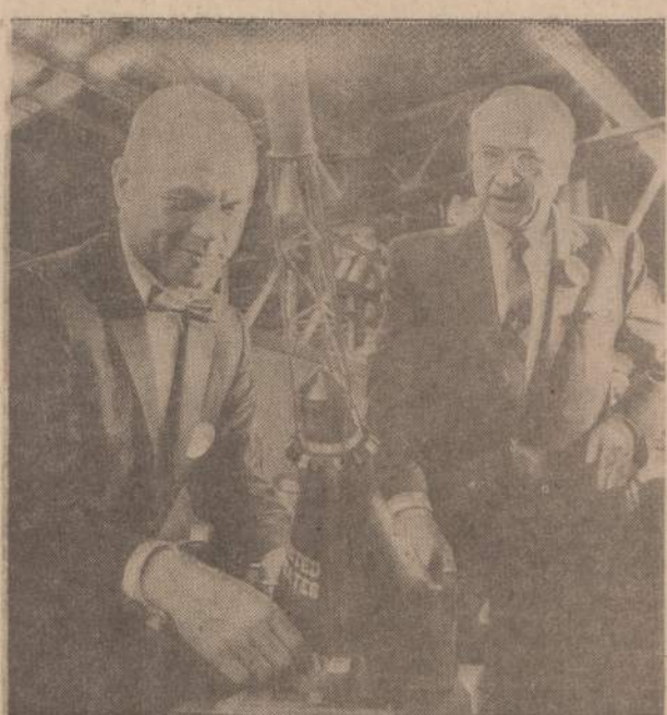
Astronautas John H. Glenn žavi "Friendship - 7" erdvės modeliu, kurį jam įteikė James McDonnell, McDonnell Aircraft korporacijos (St. Louis, Mo.) prezidentas. Jo korporacija gamina Glenno erdvio laivą.

Atsikelia švedai; pietų afrikietė (balta), italas. Atsisveikina ir ramiausiai išėina. "Kas gi bus?" — žvilgtelii į