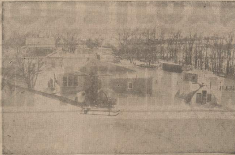
Lėktuvas ir helikopteriai buvo pristatomas maistas ir kuras fermeriams, kurie per penkis dienas niekur negalėjo išeiti, dėl nepaprastų pusnyvų. Pusnynai siekė net 16 colių gilumo. Čia parodoma viena ferma netoli Lawton, Iowa.

Reumatinį karštį, kurio pirmas požymis yra gerklės skaudėjimas, sukelia A grupės streptokokai. Toliaus reumatinio karščio simptomai yra temperatūros pakilimas, skausmingas iš vietos į vietą persimciantis artritis ir dažnai širdies sugadinimas.