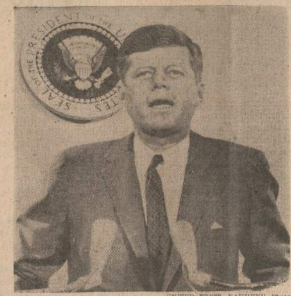
Baltųjų Rūmų Fish kambaryje prezidentas Kennedy skaito raštą, kuriame jis išdėsto savo pasiūlymą įvesti federalinę kontrolę maisto, vaistų ir kosmetikos prekybai.

Prancūzų slaptosios armijos teroristai, kovoję visą laiką pačiu barbariškesniu būdu prieš Alžerijos užleidimą arabams, pranešė, kad jie sudarė Alžerijos vyriausybę ir paprašė generolą Raoul Salan vadovauti tolesnėi kovoj už Alžerijos išlaikymą prancūzų rankose.