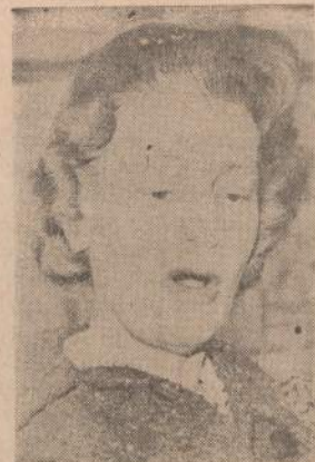
Mrs. Mary Rockefeller išveina iš Reno (Nevada) teismo rūmų po gavimo skyrybų nuo New Yorko gubernatoriaus Nelson Rockefeller. Perskyrybų byla tęsėsi tik 20 minučių.