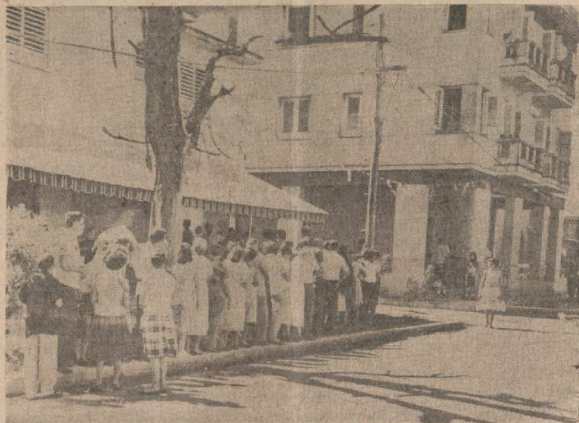
Kubos gyventojai pradeda ragauti komunizmo vaisių. Paskelbus maisto racioną, dar mažiau krautėve beliko maisto produktų. Vaizdelyje matoma eilė prie krautuvės, kuri bereginti susidarė žmonių išgirdus, kad toje krautuvėje gauta mėsa.

Kova už Alžerijos nepriklausomybę charakterizuoja vieną iš brutališkiausių epizodų naujųjų laikų istorijoje. Per 7 metus