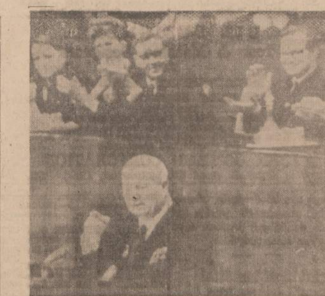
Sovietų premjeras Nikita Chruščiovas sėdi, kad Rusija turinti tokias raketas, nuo kurių JAV negalėsiančios apsiginti.

Prieš darydami bandymus su žmonėmis Michael Reese bioche-mijos departamento tyrinėtojai medikai darė panašių bandymų seriją su gyvuliais ir rado, kad "kramtytojai" sveikatos atžvil-