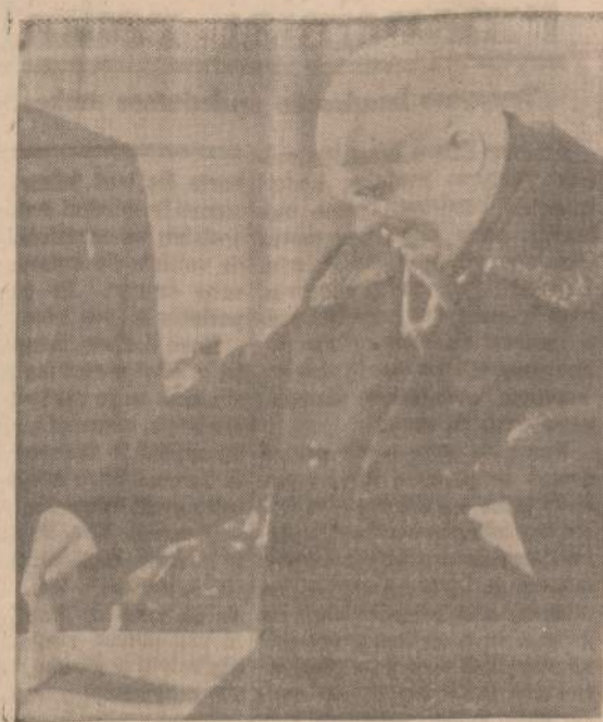
Nikita Chruščėvas per sovietinius rinkimus į aukščiausiąjį so-vietų, pats už save atiduoda balsą. Komunistiniuose "rinkimuose" yra tik vienas kandidatų sąrašas, tad balsuotojams belieka vien at-likti formalumas.