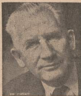
Senatorius Paul Douglas sulaukė 70 metų amžiaus