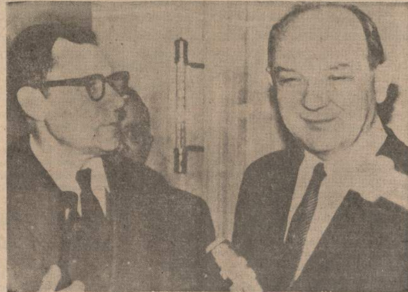
Sovietų už. reik. min. Gromyko (kairėje) ir JAV valst. sekretorius Dean Rusk po konferencijos Berlyno klausimų atsakinėja į laikraštininkų klausimus. Rusk pasakė, kad "dėl Berlyno nepadaryta jokios pažangos".

Į saugumo organų rankas patekęs vėl vienas didelis sukilėlių vadas, Vakarų Alžiro pogrindžio viršininkas, Slaptosios armijos vado Salano pavaduotojas gen. Edmond Jouhaud, pagautas sekmadienį, bus teisiamas Paryžiuje už 2 savaites. Jis jau anksčiau buvo nuteistas už akių mirties bausmę.