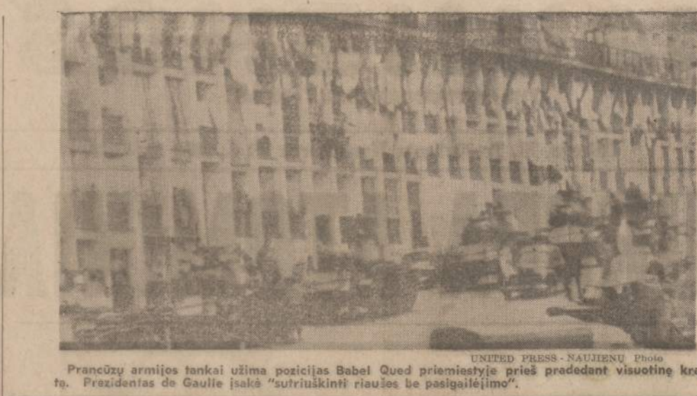
Prancūzų armijos tankai užima pozicijas Babel Qued priemiestyje prieš pradėdami visuotinę krautę. Prezidentas de Gaulle įsakė "sutrūškinti riaušius be pasigailėjimo".

Jeigu tai dirbtuvėlei būtų leide gaminti stogams dengti plokštės, tai būtų dar pusė bėdos. Bet rusams prirėkė namų miestuose. Jiems prirėkė didelių cemento blokų, kad statytų paspartinus. Toje pačioje dirbtuvėleje pradėjo gaminti sienoms reikalingus blokus. Vėliau pastatė elektros stotį. Ji galėtų gaminti daugiau elektros, bet planuotojai nenumatė stulpų elektros laidams pravesinti. Kokia nauda iš elektros, jei jos negali nuvesti į miestelius