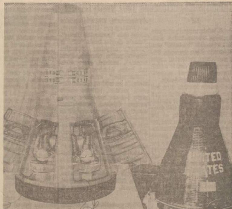
Gemini erdvinių laivo modelis, kokiu netolimoje ateityje skris du astronautai. Gemini (kairėje) parodytas su Mercury laivu, kokiu aplink žemę 3 kartus apskrido astronautas John Glenn. Gemini numatomas paleisti į orbitą 1963 ar 1964 metais.

Patys gi Pabaltijo kraštai savo tarpe, aišku, pagal partijos nurodymus, glaudžiai bendradarbiauja, keičiasi patyrimu, pirmūnais, specialistais. Šalia