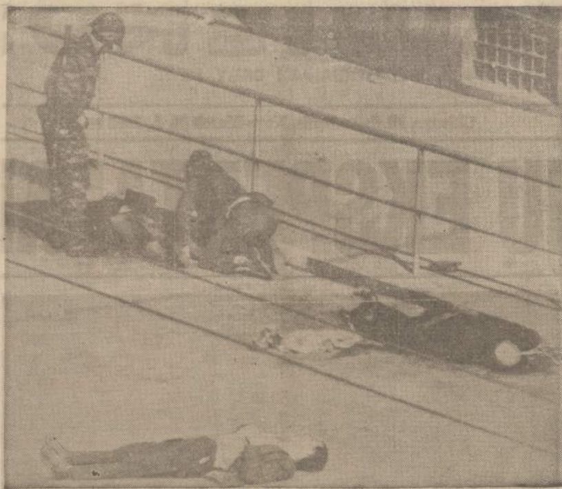
Demonstrantams pradėjus iš priemiesčių žygiuoti prie centrinio pašto Alžire, prancūzų armijos dalinys juos pasitiko šūviais. Mažiausiai 50 žmonių buvo nukauta ir 150 sužeista.