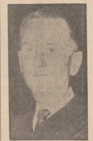
JAV aukščiausiojo teismo teisėjas Charles Whittaker dėl sveikatos atsisakė atsistatydinti iš pareigų. Prezidentui Kennedy teks paskirti jo vieton kitą.

Dėl įtakos sukommunistintoje Kuboje ir dar neaiškioji būsimoj Alžerijos respublikoj Maskva su Peipingu taigpi veda aštrią kovą. Chruščevas pasiskubino pripažinti Alžerijos vyriausybę tuoj po paliaubų paskelbimo su prancūzais. Per tai vos nenutrūko diplomatiniai santykiai su Prancūzija (De Gaulle atšaukė savo ambasadorių). Vienok Maskva pasivielino, palyginus su Peipingu, dviem metais. Jis pripažino Alžerijos arabų sukilėlių laikinąją valdžią Tunise jau 1960 m. pavasarį.