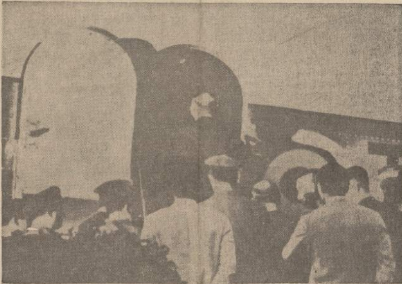
Buv. Argentinos prezidentas Arturo Frondizi, civilių ir kariškių apsuptas, eina į lektuvą, kurio buvo išgabentas į Martin Garcia salą.

Iš sunkiai apsaugomų sričių vietiniai gyventojai iškeliami į naujus kaimus. Kaimai aptveriami spygliuotomis vielomis, apstatomi sargybonomis, taip kad komunistų partizanams pasidaro sunku įsimašyti į vietinių gyventojų tarpą, o atėjus nakčiai — pradėti gyventojų žudymą.