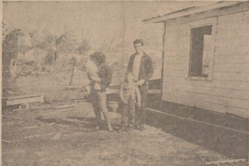
Viena šeima stovi tuščioje vietoje savo buvusio namo, kuri tornadas, perėjęs per Milton miestuką, Floridoje, nukėlė nuo pamatų ir nunešė už 135 pėdų. Šeima buvo nunešta kartu, bet visi išliko nesužeisti. Nuo tornado ten žuvo 17 žmonių.

"Šis potvarkis iškelia klausimą, kiek Europa ir visas pasaulis gali pasitikėti Jungtinių Valstybių. Tai buvo rimta politinė klaida, nes sukėlė aršią opoziciją Europoje, geriau-