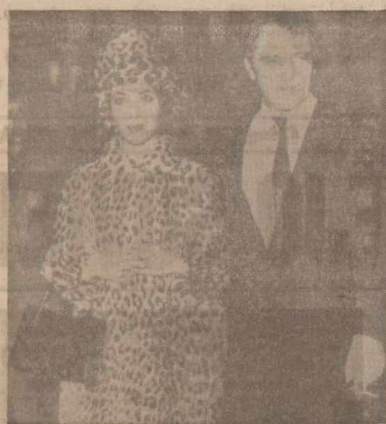
Filmu žvaigždė Elizabeth Taylor su aktoriu Richard Burton išėjęs iš naktinio klubo Romoje. Jos vyras Eddie Fisher vis dar neigia žmonos norą skirtis su juo.