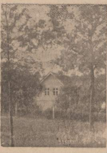
jam lengva žemėlė. Likusieji jį tančiai lankysim.