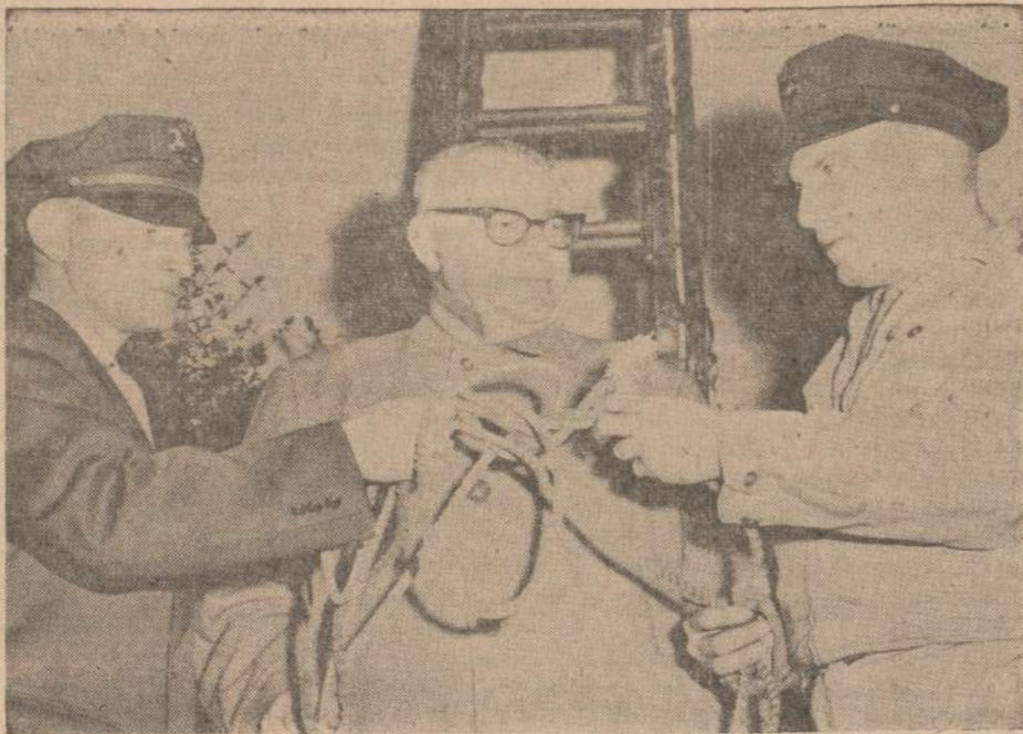
San Quentino kalėjimo viršininkas su padėjėja tyrinėja virve, kuria nusileidė nuo 40 pėdų aukštumo sienos pabėgė 5 kaliniai. Sieną jie užlipo sudurtomis kopėčiomis, kurias ankščiau buvo pasivogę.

Valandos: Kasdien nuo 9 ryto iki 4:30 po pietų. Ketvirtadieniais nuo 9 ryto iki 8 val. vakaro. Trečiadieniais uždaryta.