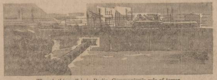
Though this wall is in Berlin, Communism's rule of terror threatens free men everywhere. One way Americans help safeguard their freedoms is by buying U.S. Savings Bonds.

now, so you'll be sure to have it tomorrow. How about doing your saving with U.S. Savings Bonds? It's a move you can make today to make your future more secure. You won't find it printed on a Savings Bond, but one of its benefits is the strengthening of freedom itself.