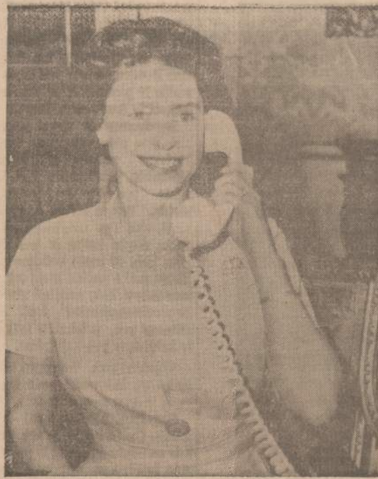
Anglijos karalienė Elzbieta kalbasi per telefoną su savo motina.

Todėl keli stambūs republikonų šulai ėmė derėtis su sen. Mansfieldu. Rezultate buvo išdirbtas abi šalis patenkinaš kompromisinis pasiūlymas: paskirti $100,000,000 finansinei J. T. paramai ir leisti prezidentui Kennedy su naudoti šitą sumą tokiu būdu, koks bus geriausias Ame-