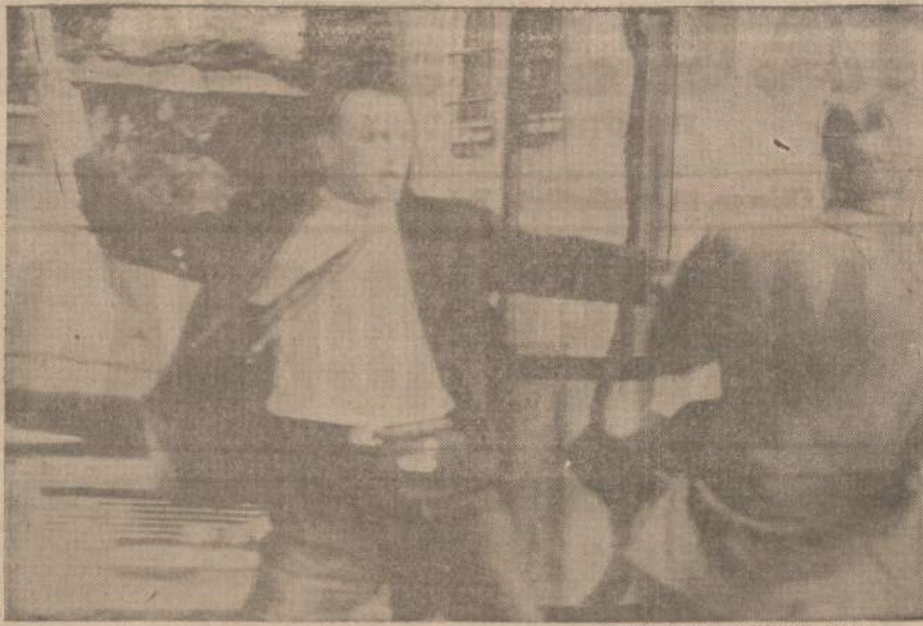
Richard Burtono šoferis šiuolaiko vaiko fotografas, kad nefotografuotų jo ir Elisabeth Taylor, kuri "šeimyniškai" pietuoja jos rezorte Torvinica, Italijoje. Miss Taylor su savim turi šis savo vaikus ir Hollywoodo savo vyrą.