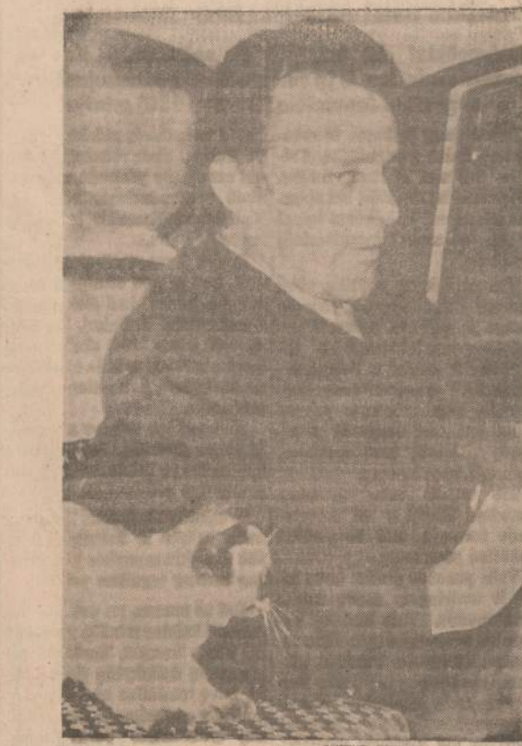
Britų aktorius Richard Burton, su kuriuo Amerikos "žvaigždė" Elisabeth Taylor pradėjo flirtuoti Italijoje. Jos vyras Eddie Fisher per advokata tuos tarpus paskelbė, kad Taylor ir Fisher "bendru sutarimu" skiriasi.

Amerikos lietuviai per savo Altą jau 20 metų dirbdami ir aukodami Lietuvai, padarė milžinišką įtaką į JAV vyriausybę, kad nepripažintų maskoliams Lietuvos okupacijos. Amerika pasekė ir daug kitų valstybių. Jei ne Alto pastangos, kažin ar šiandien galėtume didžiūnais, kad didžiausioji pasaulio demokratinė valstybė yra mūsų ken-