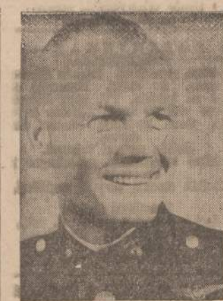
John Glenn ir kiti 6 Amerikos astronautai neprimėmė turtingo Texaso gyventojų dovanų — puošnių vilų.