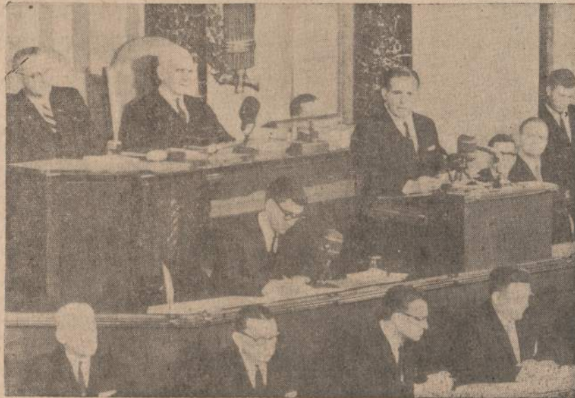
Brazilijos prezidentas Joao Goulart, kalbėdamas bendrame kongreso posėdyje Washingtone pasakė, jog jis yra "tikras", kad taikingsė lenkynėse su komunizmu dėl asmens laisvės demokratiškai kaip tobuliausia valdžios forma išeis laimėtoja.

Jis siūlo per metus įleisti 250,000, iš kurių 50,000 galėtų būti pabėgėliai ir įkeliautų be kvotų. Kvotas siūlo skirstyti pagal sveitimų šalių gyventojų skaičių, bet laikantis ir senųjų kvotų. Neišnaudotas kvotas senatorius siūlo pervesti ateiviams tų tautų, kurių kvotas yra perpildytos.