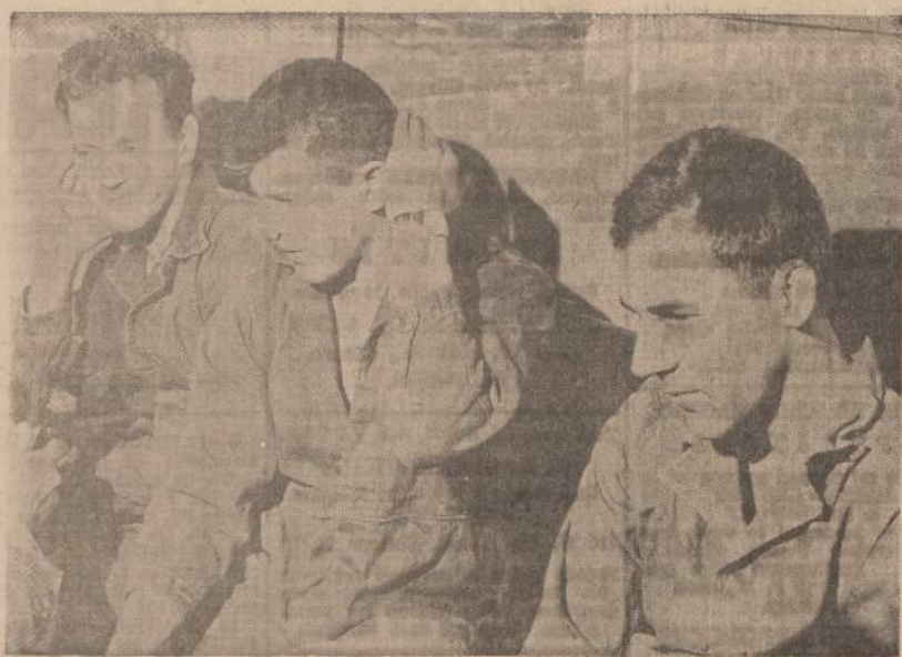
Trys iš San Quentin kalėjimo pabėgę kaliniai viena diena išbuvo laisvėje vėl grąžinti į kalėjimą. Visi penki pabėgę kaliniai buvo surasti už 10 mylių nuo kalėjimo, kai vienos ukiminkės su juos susekė pradėjo smarkiai loti.