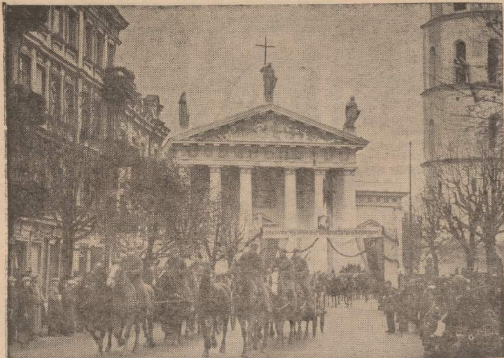
1939 metais Lietuvos kariuomenė paraduoja Vilniaus gatvėmis