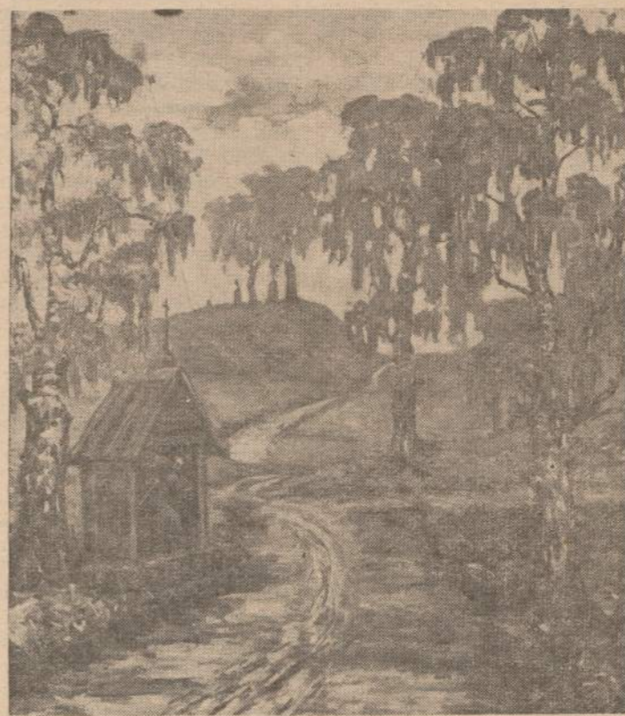
Dail. IGN. ŠLAPELIS