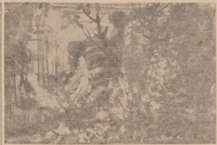
Dail. AD. GALDIKAS Peizažas

Chicagos Meno institute ba-landžio 26 d. antrame muzie-jaus aukšte atidaroma vaikų meno darbų paroda, pavadinta "Jūsų vaikų menas". Paroda baigsis gegužio 6 d.