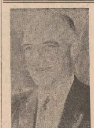
Gen. Lucius D. Clay išskrido iš Berlyno į Washingtoną, kur jis pasimatys su prezidentu Kennedy ir aptars savo pasitraukimą iš prezidento įgaliotinių Berlyne.

Prezidentas Kennedy pasiuntė Vakarų Vokietijos kancleriu raštą, kuriame išdėstyta nauja pažiūra ir nauji planai apie Vakarų sąjungininkų susisiekimą su Berlynu.