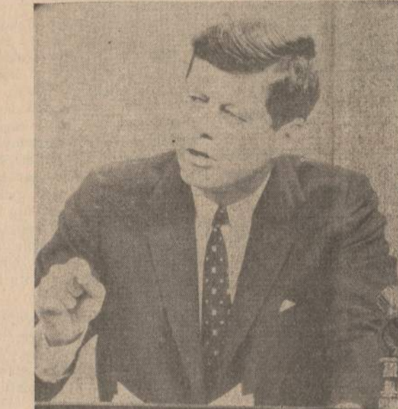
Prezidentas Kennedy spaudos konferencijos metu griežtai pamerkė plieno kompanijas, kurios paskelbė pakeliantis kainą plienui, — šešius dolerius tonai.

mo ir šaudymo planus 1940-41 metais. Minėti pirmieji trys NKVD viršininkai buvo sušaudyti tuoj po Stalino mirties, prasidėjus Kremliuj džiunglinei kovai dėl valdžios tarp Berijos, Chruščevo, Malenkovo ir Molotovo. Generolai Kruglov ir Serov išliko gyvi ir keletą metų išsilaukė vadovaujančiose vietose prie Chruščevo.