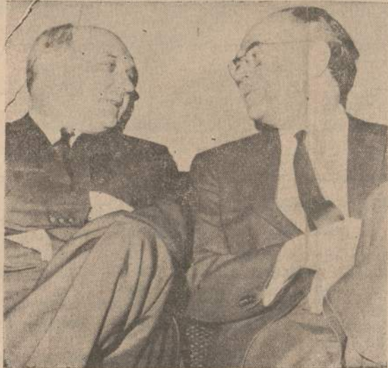
Valstybės sekretorius Dean Rusk ir sovietų ambasadorius Anatoly F. Dobrynin neoficialiai kalbasi Washingtono pirm negu pradėjo oficialų pasitarimą ryšium su Vakarų Berlynu.

Daugis komunizmo žinovų tačiau pataria Vakarams nedaryti iš komunistų šeimos barnių toli einančių išvadų, kaip JAV-SSSR naujos gynybos sąjungos prieš Kiniją, kaip geltonąjį pavojų.