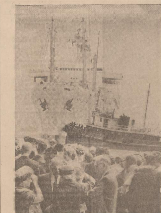
Mariposa laivas, vilkiko traukiamas, apleidžia San Francisco uostą. Prezidentas Kennedy, pasiremdamas Taft-Hartley įstatymu, įsakė atšaukti streiką ir per 80 dienų tartis dėl naujos sutarties.

"NAUJIENOS" KIEKVIENO DARBO ŽMOGAUS DRAUGAS IR BIČIULIS