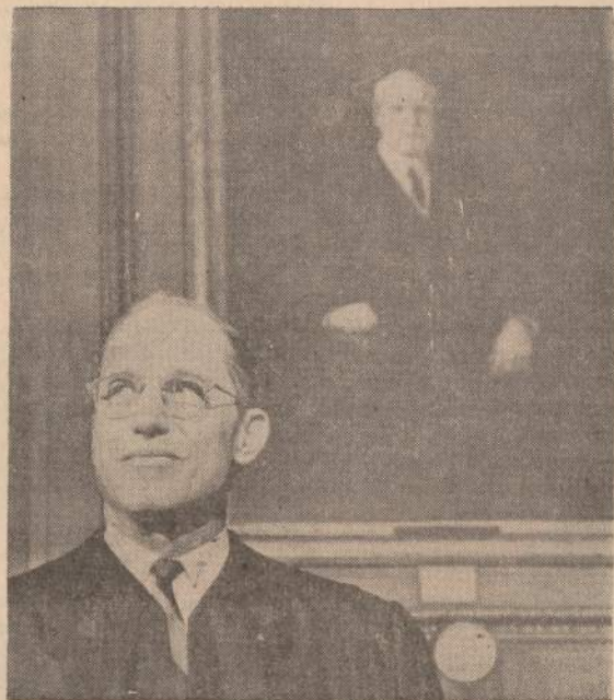
Byron R. "Whizzer" White, naujai paskirtas Aukščiausiojo teismo narys į vietą dėl ligos atsisątydinusio teisejo Whittaker.

Draugystei sustiprinti pirmadienį atskrido SSSR užsienio reikalų ministeris Andrei Gromyko. Aerodrome jį pasitiko jo kolega Popovič, išstaciūs kariuomenės garbės kuopą. Gromyko išbuš Jugoslavijoj 5 dienas, per kurias turės progos išsikalbėti su Titu apie šių šalių ir viso komunistų pasaulio problemas.