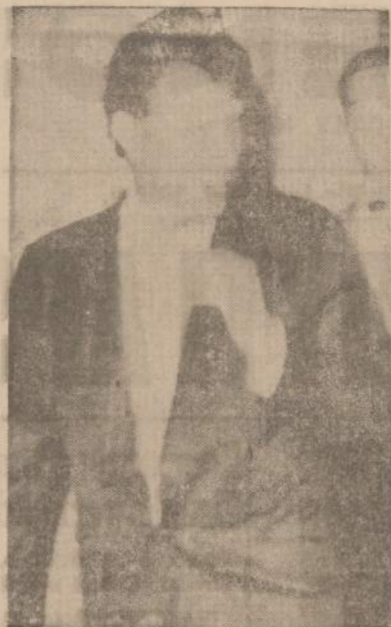
Aktorė Elizabeth Taylor apėjo restoraną Romoje, kur tarp jos ir aktorius Richard Burton įvyko nesupratimas.

Po $25 — Am. Lietuvių Ry- mo Katalikų Federacija Chica- gos skyrius, Chicago Lietuvos