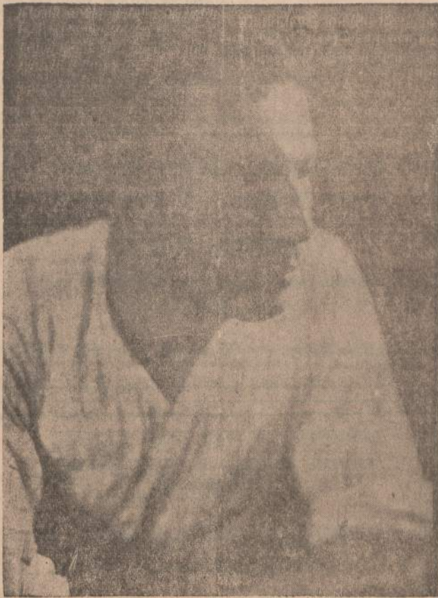
Butkų Juzė mirė prieš 15 metų

Rytoj, balandžio 22 dieną, suėmė lygiai 15 metų, kai rusų pavertoje Klaipėdoje mirė žemaičių artojų poetas Butkų Juzė. Jis 1893 m. liepos 15 d. gimė Kretingos apsk., Pažvelsių kaime, mirė Klaipėdoje, o palaidotas Telšiuose.