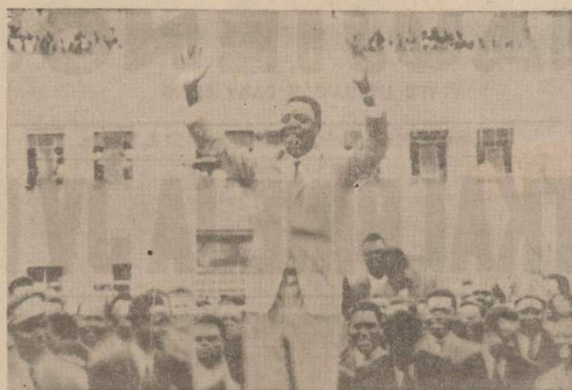
Kétagos prezidentas Moise Tshombe, Jungtinių Tautų globoje grįžęs iš Kongo sostinės Leopoldvilles į savo sostinę Elisabethville, mosikuoja susirinkusiems katangiečiams.

"Vaikams, mėgstantiems pasakąs, jis ir buvo pakviestas lankyti su dovanomis Kalėdų metu". To "jo" būta šv. Nikolajaus. Bet nei kur, nei pas ką