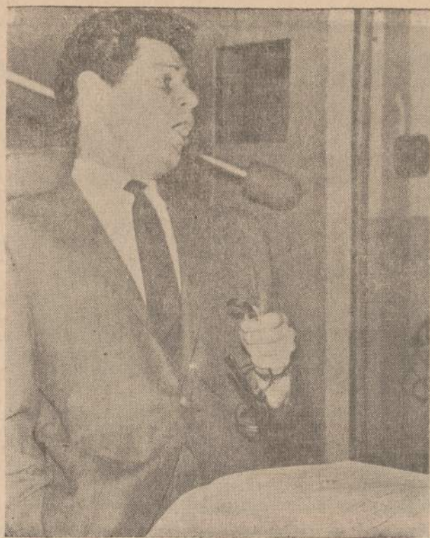
Dainininkas Eddie Fisher, kurio vedybos su aktores Elizabeth Taylor baigia paimti, dainuoja New Yorko pokštelių rekordavimo studijoje.