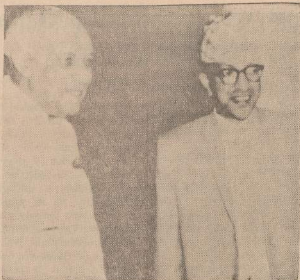
Indijos premjeras Javaharlal Nehru sveikina su Nepalo karalium, šiam atvažiuojant į New Delhį penkių dienų vizitui.

JAV-bės nepripažintų Lietuvos prijungimo prie Rusijos. Lanko JAV-bių prezidentus, daro įtaką į kongreso bei senato narius. To dėka Amerikoje pasiliko veikti Lietuvos pasiuntinybė ir konsulatai.