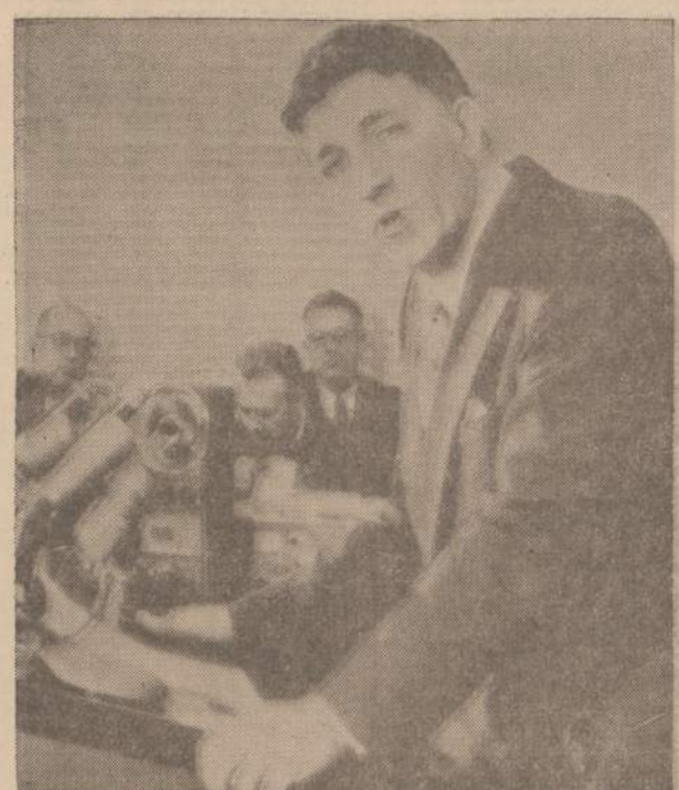
Federalinės civilinės aeronautikos agentūros administratorius Naieeb Halaby, pasisakydamas apie lėktuvų nelaimės, pareiškė: "Jei turime ką kalbėti, tai gerime kalbėti pasenusia oro trafiko kontrolės sistema, kuri nebuvo gerinama per 15 metų".