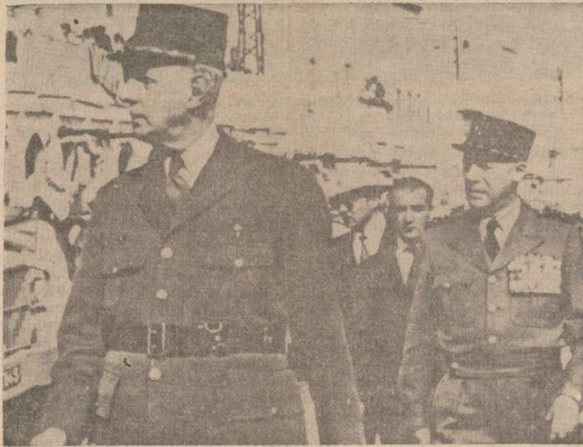
Prancūzų slaptosios policija (Surete) Alžire suėmė prezidento De Gaulle priešr. Nr. 1, eksgenerolą Raoul Salan, slaptosios teroristinės armijos OSA vadą. Čia Salan matomas einant paskui De Gaulle, kai pastarasis buvo atvažiavęs į Alžirą inspektuoti kariuomenės 1959 metais, kada Salan buvo vyr. armijos viršininkas.

♦ Pietų Vietnamo gyventojai iš Binh Duong srities, kur yra prisivėję daug komunistų partizanų, priešinosi kaip galėdami valdžios potvarkiams juos įkurdinti saugesnėse vietose. Jauni vyrai bėga į džungles ir prisijungia prie partizanų, kad ir nebūdami komunistais.