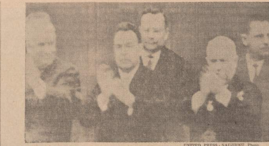
Sovietų premjeras Nikita Chruščiovas (antras iš dešinės) ploja pirmos sešto sovietų parlamento sesijos atidarymo Maskvoje metu. Iš kairės į dešinę: Komunistų partijos Centrinio komiteto se-kretorius Frol Kozlov; Sovietų prezidentas Leonid Brežnev ir S. Polianski, prezidiumo narys.