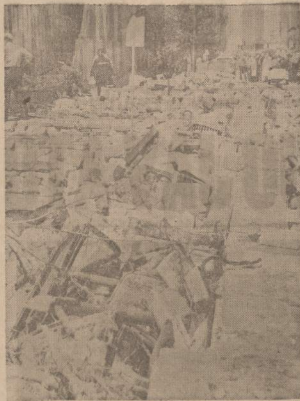
UNITED PRESS - NAUJIENU PHOTO Visa eilė automobilių buvo suptota, kai užvirto fabriko siena. O tai atsitiko Fairfax pramonės distrikte, esančiame Kansas City, Kansas. Ten insulation fabrike įvyko sprogimas. Kiek žinoma, žuvo vienas asmuo ir keli buvo sužeisti.