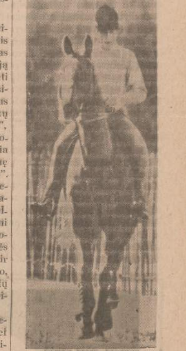
Princas Charles, Anglijos karalienės vyresnysis sūnus, bando žaisti savo tėvo mėgiamą polo žaidimą. Princas yra 13 metų amžiaus.

Būdinga, kad ir komunistinis pareigūnas pripažįsta, jog šių dienų Lietuvoje radijo imtuvas bei televizorius virto „papuošalu“, riogsančiu klube — skaitykloje, kultūros namuose, raudonajame kampelyje ar bendrabutyje. Jis, suprantama, ir likis tik namų papuošalu, bent ligi to meto, kai radijas galės atlikti tikrąjį kultūrinimo paskirtį, bet ne būti, nors ir veiksmingu, kontunistinės agitacijos įrankiu.