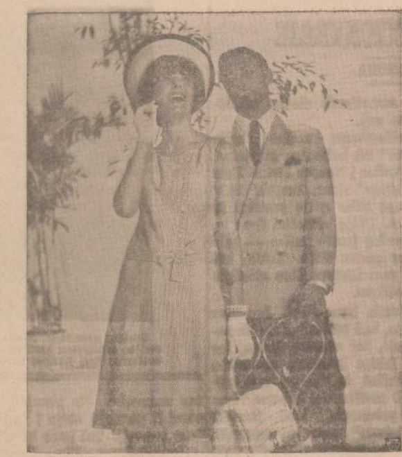
Pavasario ir vasaros sezonui pradėti gaminti motorų ir vėjų drabužiai iš „tikrų vilnų“. Drabužiai yra labai lengvi ir „vesi“. Naujoji vilna esanti ne tik vėsi, bet ir nesiraukšlėjanti.

Bet gal juos paveiks prezidento Kennedy autoritetas, jeigu jisai juos stipriai paspaus.