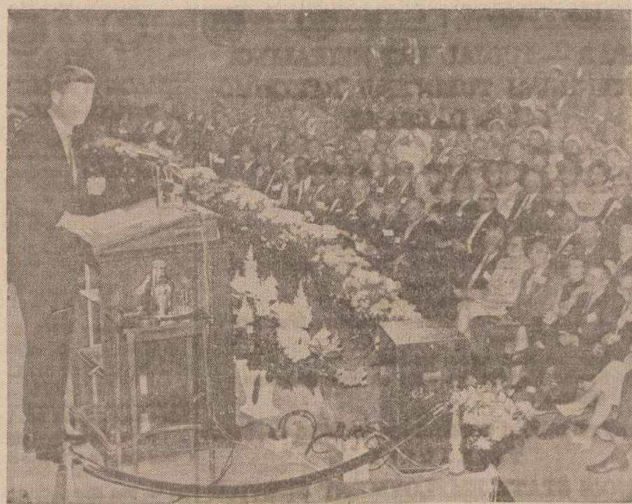
Prezidentas Kennedy sako kalbą Amerikos Prekybos Rūmų 50-je konvencijoje, kuri įvyko Vašingtone.

JEI NENORI ATSLIKITI NUO PASAULIO ĮVYKIŲ - SKAITYK "NAUJIENAS" - JOS TEIKIA GERIAUSIAS, TEISINGIAUSIAS ŽINIAS