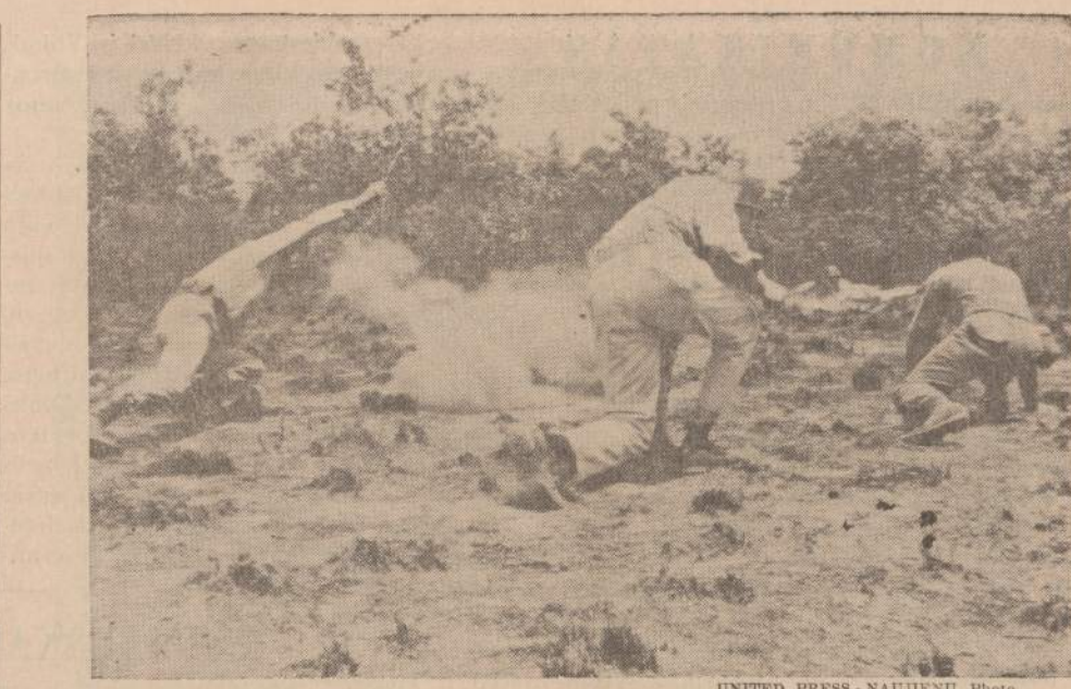
Kelių mylių atstume nuo Miami (Fla.), vadinamuosiuose Everglades, treniruojasi grupė kubiečių.

Valgėme viešbučio restorane. Viskas skanu. Šviežios daržovės ir nebrangu. Atsisėdęs vienas sau galvoju, kaip komunistai 1917 metais nuvertę Kerensko valdžią žadėjo liaudį viskuo aprūpinti, ypač darbininkus. Per tuos dvyliką metų nieko neat-