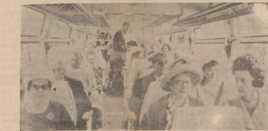
Apie pusantro šimto karališko dvaro svečių liuksusinius autobusus keliavo iš Amsterdamo į Lisaboną Olandijos karalienės Julianos pavasarinių gėlių, kurių čia yra milijonai. Toji išvyka buvo surengta ryšium su karalienės 53 metų amžiaus ir 25 metų vedybinio gyvenimo sukaktimi. Čia parodomas vienas tu autobusu, kuriame yra Kento princesė Marina (dešinėje); Irano šachas ir jo žmona (antra sėdyne, dešinėje), princas Bernard kalbasi su karaliene Juliana; Anglijos karalienė Elizabeth (Julianos priešakyje); kairiosiose sėdyne: Norvegijos karalius Olav (antra sėdyne); Švedijos princas (trečia sėdyne); Liuksemburgo kunigaikštis Jean (ketvirta sėdyne), ir Liuksemburgo princesė Josephine Charlotte.