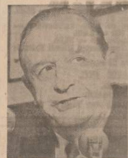
Orvel E. Faubus, Arkansas valstijos gubernatorius, prieš kurį laisvė buvo pareikšas, jog jis nebekandidatuos penktam terminui. Tačiau dabar jis pakeitė savo nuomonę ir pareiškė, jog jis ir vėl kandidatuosias gubernatoriui.