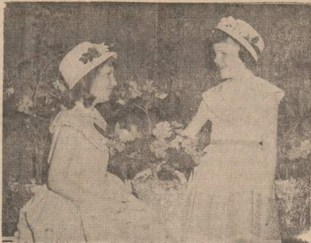
MERGAITĖS PRIE BRAZILIJOS VANDENS MEDŽIO