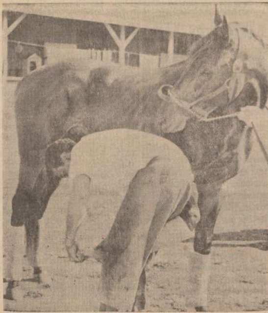
Louisville, Ky. — Sir Ribot paruošiamas Derby arklių lenktynėms.