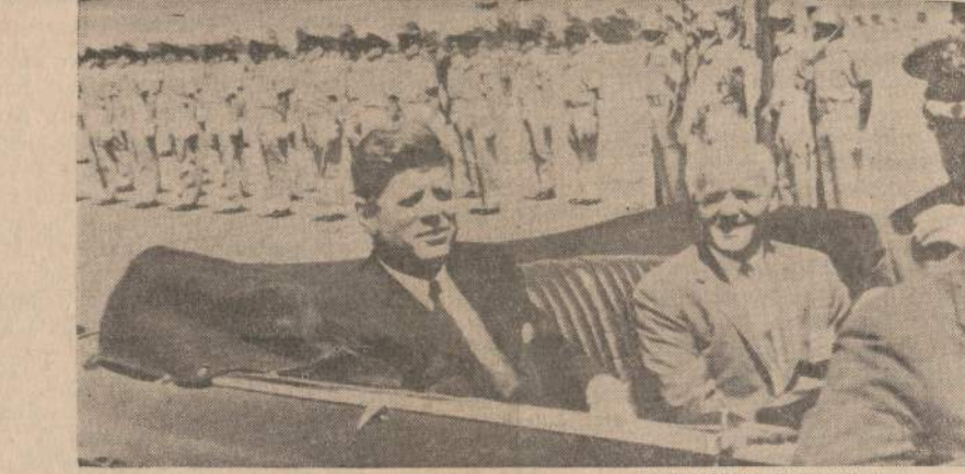
Prezidentas Kennedy ir oro pajėgų sekretorius Eugene Zuckert važiuoja atvirame automobilyje į Eglin AFB, Floridoje.