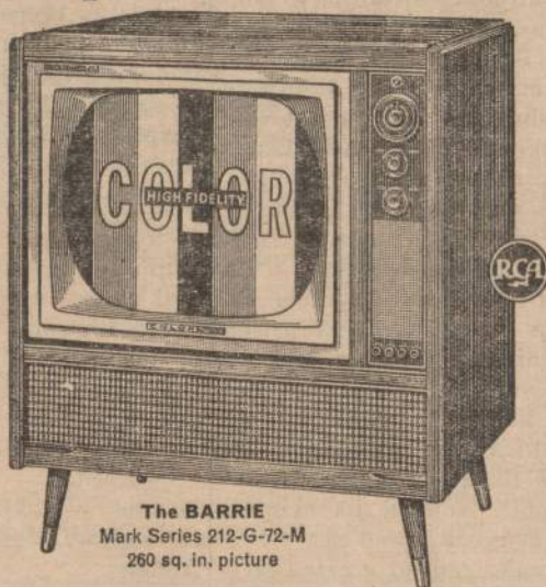
The BARRIE Mark Series 212-G-72-M 260 sq. in. picture