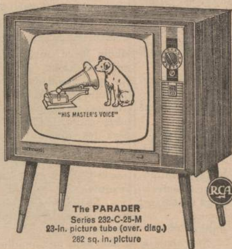
The PARADER Series 232-C-25-M 23-in. picture tube (over. diag.) 282 sq. in. picture

Famous RCA Victor quality and value in a budget-priced Modern consolette. Powerful "New Vista" Tuner and RCA's 23-Inch tube (overall diagonal) Full-Picture (282 sq. in. picture) for superb black-and-white viewing. Full-range "Golden Throat" tone for rich, realistic sound. Don't miss this big TV buy! Quantities limited!