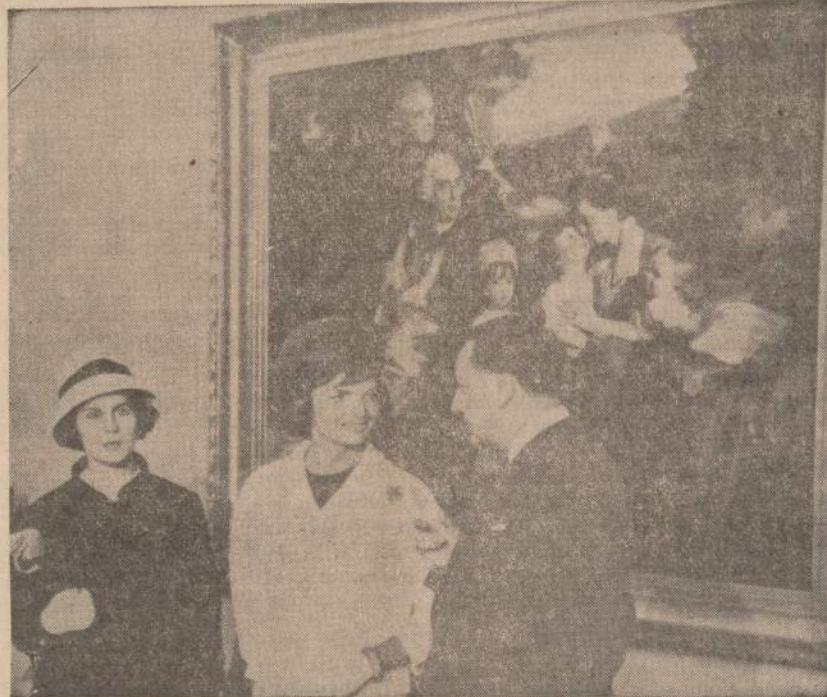
Prezidento žmona Jacqueline (viduryje) apžvelgė Nacionalinę meno galeriją Washingtono Prancūzijos kultūros ministeriui Andre Malraux (dešinėje) ir jo žmonai.

◆ 14 ir 11 metų vaikai prisipažino, kad jie nuvertė prie Unionstov, Pa., prekinį traukinį, nusukdami bėgius iešmo pagalba. Vienas geležinkelietis žuvo, kitas — sunkiai sužeistas.