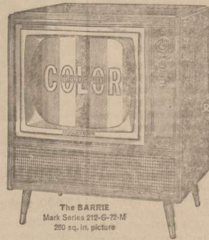
The BARRIE Mark Series 212-G-72-M 280 sq. in. picture

LOOK AT THIS LOW PRICE FOR RCA Victor COLOR TV