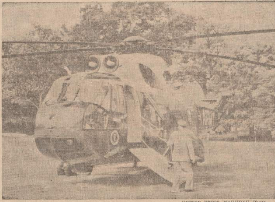
Prezidentas Kennedy lipa į naują sprausminį helikopterį, kuriuo jis skrido į Atlantic City, N. J.