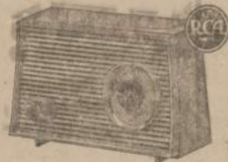
The ALPHA 3RA1 Series

The perfect radio for bedroom, kitchen or den. Finished in lovely Autumn Smoke color. With "Golden Throat" tone, direct-drive tuning and dependable Security Sealed Circuitry. An exceptional bargain at this amazingly low price!