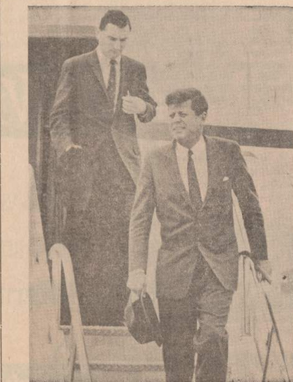
Prezidentas Kennedy skubiai grįžo iš Virginijos į Washingtoną, kur tuoj suaukė pasitarimą su gynybos ir saugumo pareigūnais dėl susidariusios krizės Laose.

◆ Buvęs Laoso premjeras neutralistas Souvana Phouma ketvirtadienį skris iš Paryžiaus į Laosą. Jis buvo numatytas vadovauti neutraliai, koalicinei vyriausybei, jei ją būtų galima sudaryti. Phouma pasakė, kad jis vis dar tikisi vyriausybę sudaryti ir atstatyti šalį ramybės.