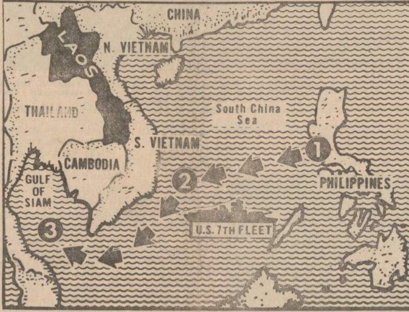
Prezidentas Kennedy dalį 7-to JAV laivyno pasiuntė su 1,800 marinų į Pietų Azijos vandenį ryšium su krize Laoso valstybėje. Laivyno dalis išplaukė iš Subic jūros. Šiame žemėlapyje yra sritis, kur dabar susidarė pavojinga padėtis.

Premjeras Boun Oum, bėdos spaudžiamas, sutiktų į koalicinę vyriausybę, jei joje komunistai negautų armijos, policijos ministerijų.