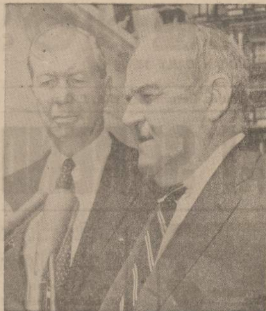
Arthur Dean (dešinėje), Amerikos nusiginklavimo delegacijos pirmininkas, su prezidentu Kennediu spaudos atstovams pareiškė, jog nusiginklavimo pasitarimai Zenevoje eina gana gerai.