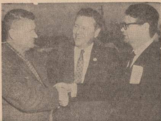
Senatorius Ralph Yarborough, Texas demokratas, pareiškė, jog Billie Sol Estes prisidėjęs su $1,700 prie apmokėjimo išlaidų, kuriuos susidariusios paruošiant programą Texaso radijo stotims. Yarborough yra viduryje, o Estes dešinėje.