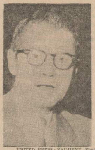
Respublikonai kelia triukšmą ir reikalauja, kad agrikulūros sekretorius Orville L. Freeman atsistatydintų, nes, esą, jo departamento tarnautoja buvusi įėga išvilktą iš ofiso ir pasiūsta į psichiatrinę ligoninę, kadangi ji "per daug žinujusi" apie Billie Sol Estes aferą.