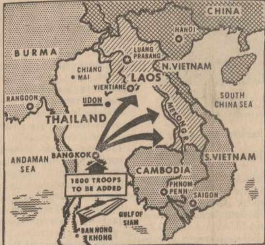
Prezidentas Kennedy išakė 1,800 marinių grupę išsikelti Bangkoke, Tailande. Amerikiečių karo jėgos ten busiančios padidintos iki 5,000 vyrų. Jų tikslas bus sulaukyti komunistus, jei tie bandys iš Laosu brautis į Tailandą.

Yra ir daugiau skirtumų, pavyzdžiui, dėl prezidento De Gaulle nenoro pripažinti Amerikai vadovaujamos vietos Nato sąjungoje ir aplamai laisvojo pasaulio kovoj prieš komunizmą.