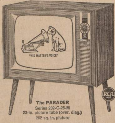
The PARADER Series 232-C-25-M 23-in. picture tube (over. diag.) 282 sq. in. picture

Famous RCA Victor quality and value in a budget-priced Modern console. Powerful "New Vista" Tuner and RCA's 23-inch tube (overall diagonal) Full-Picture (282 sq. in. picture) for superb black-and-white viewing. Full-range "Golden Throat" tone for rich, realistic sound. Don't miss this big TV buy! Quantities limited!