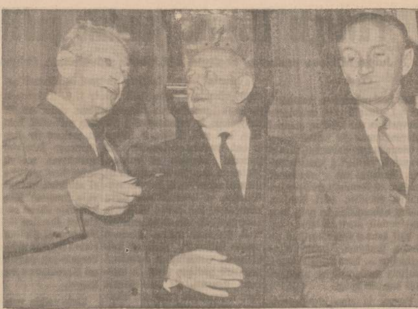
Administracijos balsavimo bilius faktiškai buvo "išaldytas", kai senatas antrąkart atsiskė apriboti pietų valstybių senatorių kalbas. Nuotraukoje senatoriai (iš kairės į dešinę) Everett M. Dirksen, Richard B. Russell ir Mike Mansfield tariasi, kas toliau daryti.