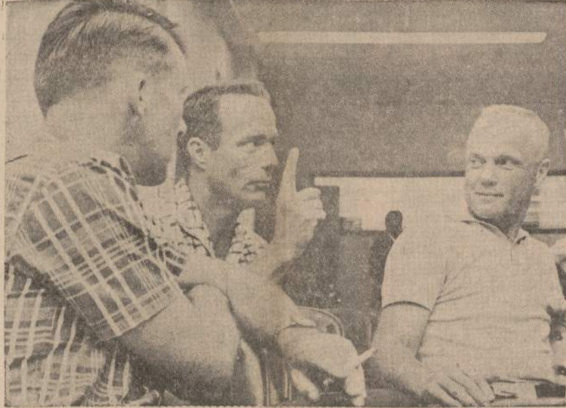
Astronautas M. Scott Carpenter (viduryje) kalbasi su pilotu Walter M. Schira (kairėje) ir John J. Glenn (dešinėje).

Udone numatyta įrengti Amerikos aviacijos bazę. Šioj srity visad netrūko vietinių gyventojų, palankių komunistams. Jų agentai varo propagandą tarp