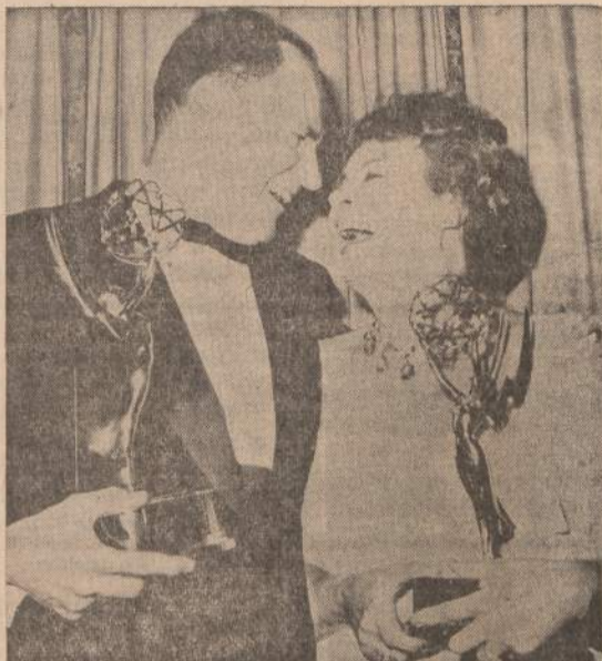
Aktorius E. G. Marshall ir aktorė Shirley Booth buvo New York'e apdovanoti "Emmy" atžymėjimu už geriausią vaidinimą televizijos serijoje "Hazel" ir "Defenders".