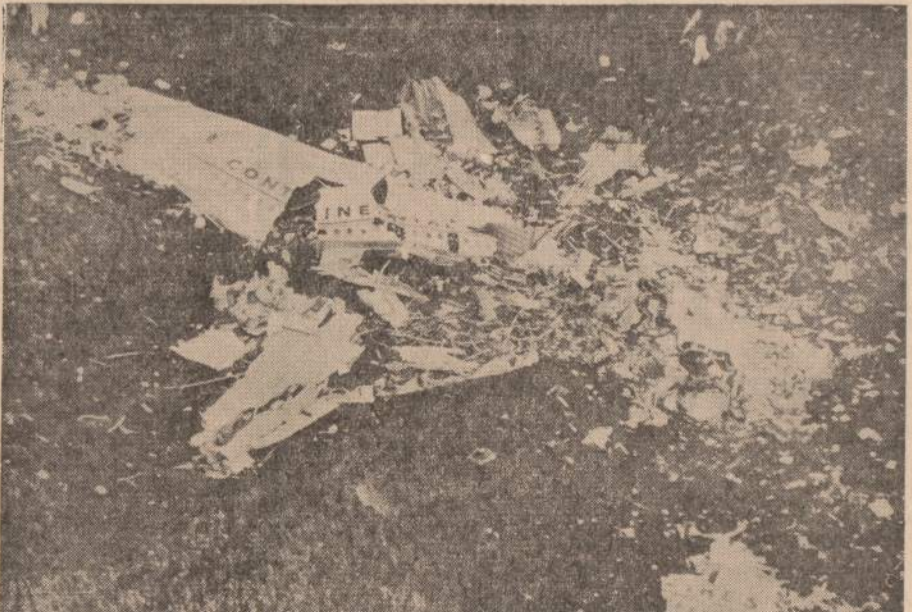
Continental oro linijos sprausminis lėktuvas, kuris sprogo ore netoli Centerville, Iowa. Visi juo skridę 45 asmenys žuvo.

PIRKITE JAV TAUPYMO BONUS 6 — NAUJENOS, CHICAGO 8, ILL. — FRIDAY, MAY 25, 1962