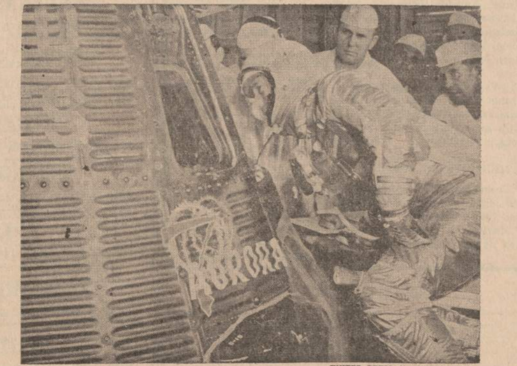
Astronautas Malcolm Scott Carpenter daro paskutinį apžiūrėjimą Aurora Seven Mercury erdvės laivo, kuriuo, netrukus po to, jis tris kartus apkelia aplink žemę.

PIRKITE JAV ĮAUPYMO BONUS 6 - NAUJIENOS, CHICAGO 8, ILL. - MONDAY, MAY 28, 1962