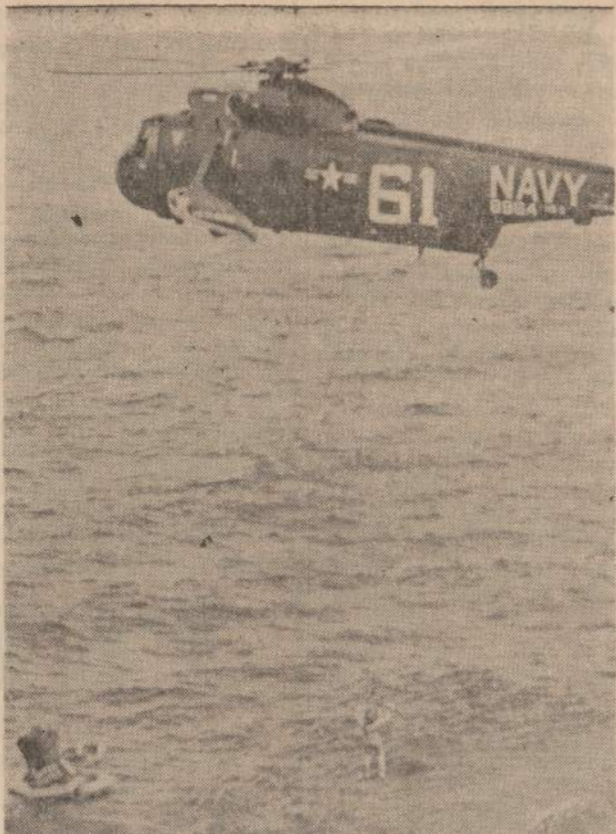
Astronautas Scott Carpenter iškeliamas iš plausto, kuriame jis išbuvo beveik tris valandas po nusileidimo iš erdvės.

ir pigus siuntiniams medžiagų pasirinkimas, pavyzdžiui, 6 vyr. kostiumams medžiaga tik $33, o su išsiuntimu $68.50. Čia viską rasite, kas tik siuntiniams reikalinga.