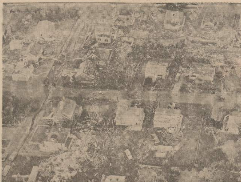
Waterbury, Conn. — Nusiaubęs tornadas sug'iovė nemažai namų. Buvo ir aukų: vienas asmuo žuvo ir keli buvo sužeisti.