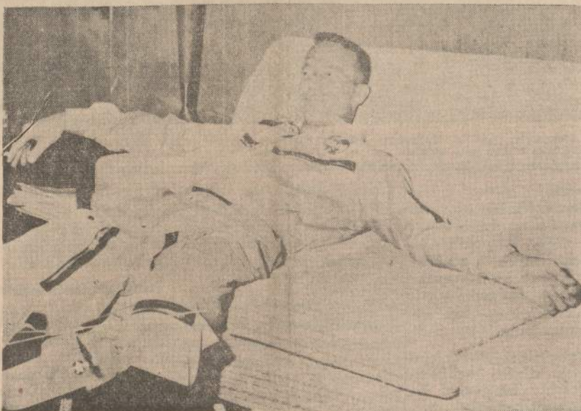
Po atvykimo į Grand Turk Island (B. I.) išvargęs astronautas Scott Carpenter ilsisi sofoje.

Apie twistą jis rašo kaip apie negrų ritualinį šokį, turintį ilgą istoriją Afrikoje. "Komsomolskaja Pravda", turinti uždavinį kovoti su amerikiečių šokiais, rašo, kad rock and roll, twist ir kiti amerikiečių šokiai savo monotonišku ritmu įvaro šokėjus ir nepasisekimus. Jam prikišamas netinkamas kapsulės kampanijos nustatymas leidžiantis į Atlanta, per ką jis pralėkė 250 mylių nuo apskaičiuotos vietos. Kuris vairavimo operacijoms taip greitai išsibaigė dėl jo kal-