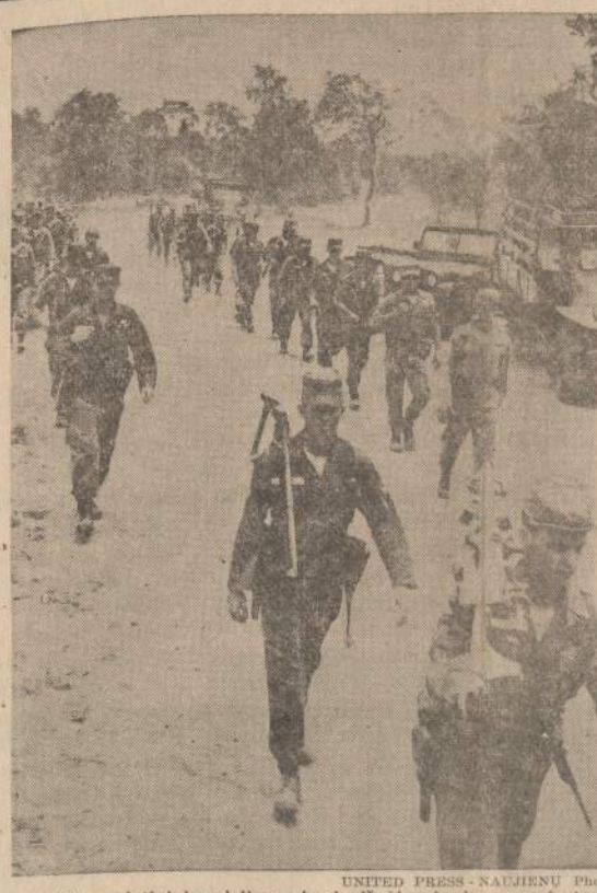
Amerikos pėstininkų dalinis, kuris iš Havajų buvo pasiųstas į Koratą, Tailandė, apie 130 mylių nuo Bangkoko.

tais, kovojo ispanų pilietiniame kare respublikonų pusėj. Grįžęs iš Ispanijos buvo suimtas; paleidus iš kalėjimo, perėjo vėl į komunistų pogrindį. 1941 metais jis prisidėjo prie Tito partizanų ir pasiekė partizanų armijos generolo laipsnio. Nuo 1945 iki 1953 metų jis buvo Jugoslavijos generalinio štabo viršininku, kartu eidamas užsienio reikalų ministerio pareigas nuo 1946 metų.