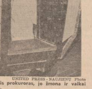
Robert F. Kennedy, generalinis prokuroras, jo žmona ir vaikai Glen Echo (Md.) pramogų parke.

Jūra išplovė į krantą ties prezidento tėvo vasarvietė Ft. Lauderdale, Fla., statinę dinamais, kuris, jei būtų sproges, būtų sugriovęs vasarvietę. Susprogdinus statinę vėliau jūroje, tirama, iš kur ją vanduo atplovė. Manoma, kad ji iškrito iš karo laivo.