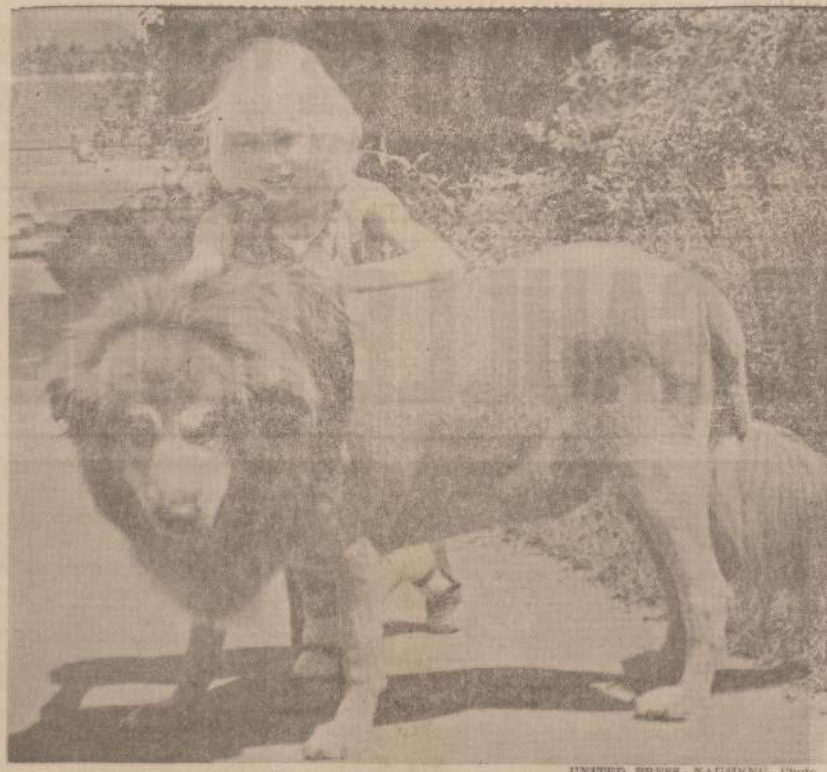
Kansas City (Kans.) — Ne vienas automobilistas buvo nustebs, pamatęs šį "liūtą". Tačiau tai ne liūtas, o paprastas šuo, kuris buvo nuskustas, kad būtų višiau.

Taip pat nereikia būti dideliu matematiku, kad suprastume, jog per katalikiškas mokyklas mes ne vienos genterkės nelaukė galime likti visai be lietuvių... jei visi lietuviai klausytų, kaip kunigai liepia — leisti savo vaikus tik į katalikiškas mokyklas ir tose mokyklose visos lietuviškos mokines klausytų mokytojų vienuolių raginimo stoti į vienuoles... Laimė, kad dauguma lietuvių tėvų ir jų dukrelių dar pajęgia atsisipirti. J. Bangputis