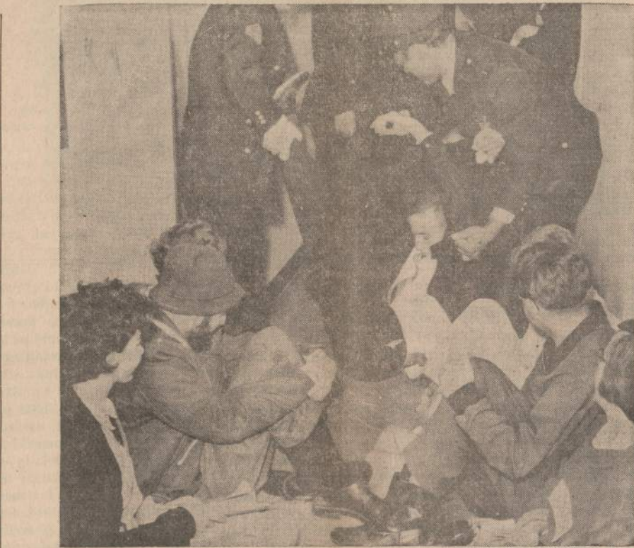
Pačifistai, kurie susirinko protestuoti prieš sulaukymą "Everyman" jachtos ir areštavimo jos igulos trijų vyrų, buvo išnešti iš San Francisco federalinio teismo rūmų. "Everyman" jachta trys vyrai, kaip žinia, buvo pasimoję plaukti į tą vietą, kur dabar vyksta branduolinių ginklų išbandymas.

Praeitais metais Irakas jau buvo paruošęs kariuomenę Kuvaitui užimti, prieš tai paskelbdamas, kad jis paima šeimystę, kaip istorinę Irako teritoriją, savo globon. Kuvaito šeikas kreipėsi pagalbos į anglius, buvusius valdytojus. Anglai tuoj permetė parašutinininkų, pasiuntė karo laivyną, ir atbaidė Iraką nuo sumanymo Kuvaitą okupuoti.