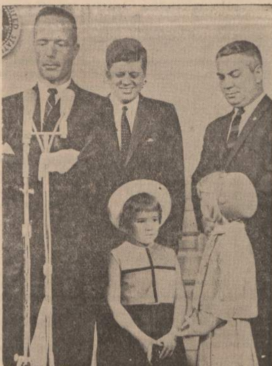
Astronautas M. Scott Carpenter ir jo šeima svečiuojasi Baltuosiuose Rūmuose pas prezidentą.