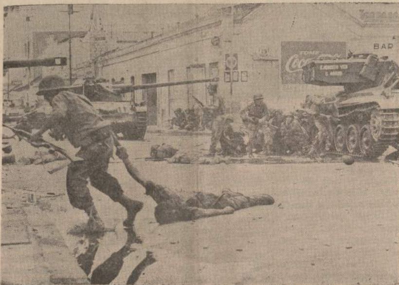
Po dviejų dienų kovų Puerto Cabello, Venecuoloje, valdžios kariuomenė sukilėlius išsklaidė. Kovose buvo užmušta daugiau kaip 400 žmonių. Vaizde vienas karys velka iš kovos linijos savo sužeistą draugą.

Amerikiečių-vietnamičių kultūros mainų draugija rengdavo šeštadieniais liaudies šokius ("square dances"). Ir tai buvo uždrausta. Bet kiek anksčiau CBS televizija rodė Afro-amerikiečių šokių rock-and roll bei twist'o pasisekimą. JAV karių klubas buvo pilnas vietinių merginų, besiraitančių pagal amerikiečių būdą.