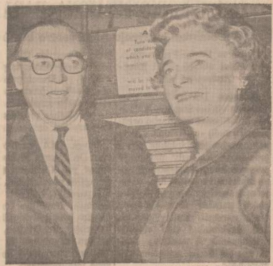
Kalifornijos gubernatorius Edmond Brown ir jo žmona, atlikę pirminius balsavimus San Francisco, Calif. Brown, demokratas, tikisi ateinančių rudenį nugalėti respublikoną Nixoną.

Toliau pasakojama, kad Lietuvos Vliskas perdavė "savo kompetencijas ir pareigas"