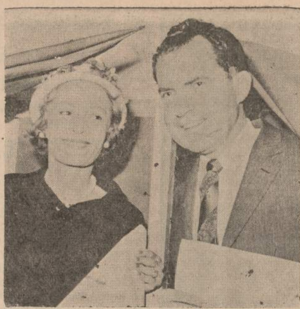
Richard Nixon ir jo žmona Pat, Los Angeles, šilke balsavimą pirmiūnė rinkimuose, aplėdžia būdele. Nixon yra kandidatas į Kalifornijos gubernatorius.

bus žmonių, kurie šiomis sąlygomis norėtų važiuoti ir į Lietuvą, kur visi kaimai išgriauti ir rusų valdžios dvarais paversti, o mūsų broliams lietuviams jų pačių tėvynėje sutverta baudžiava daug blogesnė negu kadaise buvo carinių rusų laikais.