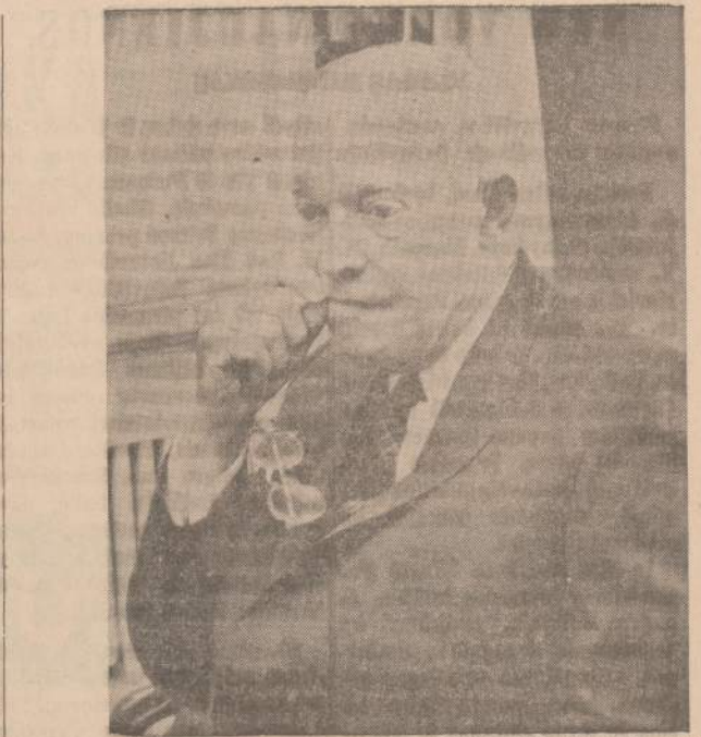
Generalas Dwight D. Eisenhower paleido "D-Day" (vokiečių kapituliacijos) 18 metų sukaktį savo Gettysburg (Pa.) farmoje, kur jis paleidžia laiką rašydamas naują knygą.

Arbe šitų pripažinimų Altui reikėjo dar kokio kito?