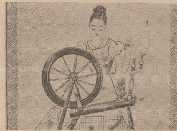
Sesulė prie ratelio...