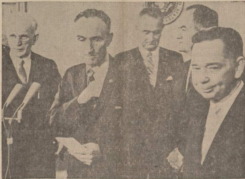
Kongreso ir senato demokratų lyderiai po konferencijos su prezidentu Kennedy. Jie pasidėjo dėti visas pastangas, kad administracijos siūloma programa būtų priimta. Iš kairės į dešinę: kongreso spyrkeris John McCormack; senato daugumos vadas Mike Mansfield; viceprezidentas Lyndon B. Johnson; senato daugumos vado pavaduotojas, ir kongreso demokratų vado pavad. Hale Boggs.

Kai buvusi jauna, ji šokusi, net baletė. Bet dabar atėjęs kietos kovos, santūrumo laikotarpis, norint atsispirti komunistams. Per savaitę kovose su komunistais žūna 1,000 vietnamiečių. Amerikiečiai turį tai suprasti ir laikyti šalies padurimu įstatymo ir įvertinti momentą rimtumą.