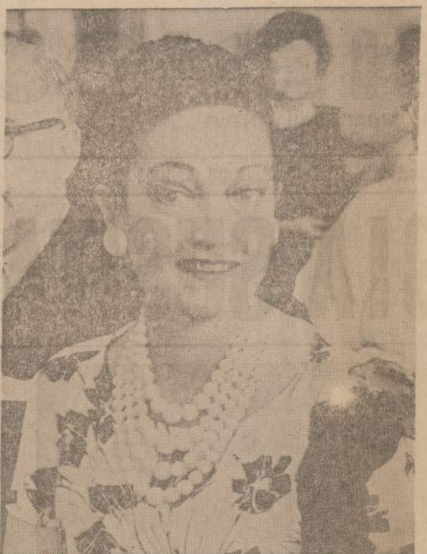
Aktorė Dorothy Lamour, kuri yra American Guild of Variety tarybos direktorė, sako, jog Senato komitetas, tyrinėjantis įsigalėjusi rakerizma naktiniuose klubuose, iki šiol susipažinęs tik su visomis neįgaliomis pusėmis. Tačiau aktorė unioje neviskas yra taip juoda, kaip atrodo iš komiteto apklausinėjimų. Ji tad norinti Senato komitetą supažindinti ir su feigiamomis unijos pusėmis.