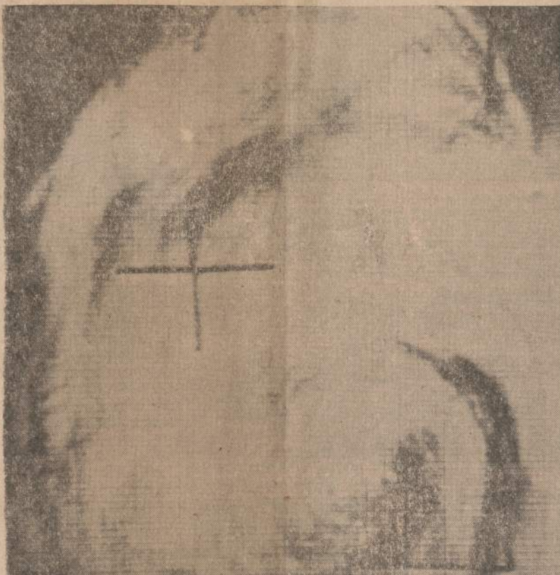
Tai audringų debesų nuotrauka, padaryta iš Amerikos meteorologinio satelito Tiros-5. Kryžium atžymėta vieta rodo pavojingos audros gūžtą į šiaurės rytus nuo Newfoundlando salos.

LONDONAS. — Prieš porą metų Fidel Castro pradėjo masiškai siųsti kubiečių vaikus į Sovietų Sąjungą apsišviesti. Ketvirtadienį laivu į Leningradą išplaukė 800 anglų vaikų, irgi apšvietimo tikslais. Bent taip vadinama jų kelionė. Leningrado uoste jie prisikviesių rusų vaikų ir bandysią sukurti draugystę.