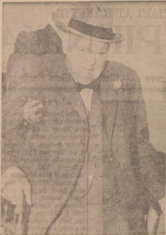
Sir Winston Churchill buvo atvykęs į Monte Carlo atostogauti. Viešbučio kambarėje jis parkrito ir susižeidė (ligo kojos kaulus). Skubiai buvo nugabentas į kliniką, kur jam buvo padaryta operacija, o po to 87 metų Churchill grįžo į Angliją.

Tamsta esi mūsų lietuviškosios visuomenės tarpe viena iš labiau prasikiusių žurnalistų tuo metu ir aš buvau. Prieš ra-