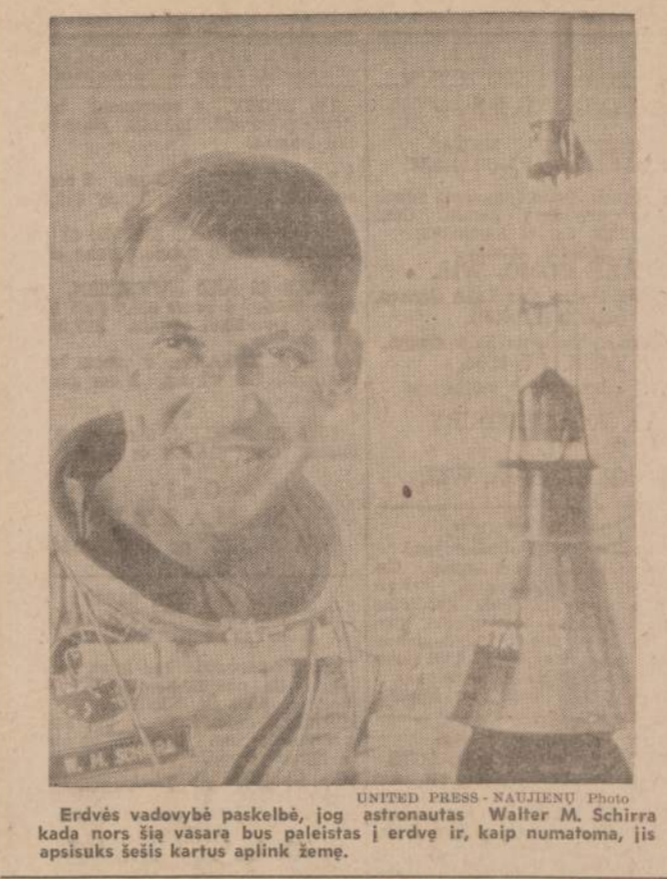
Erdvės vadovybė paskelbė, jog kada nors šią vasarą bus paleistas į erdvę ir, kaip numatoma, jis apsisuks šėis kartus aplink žemę.