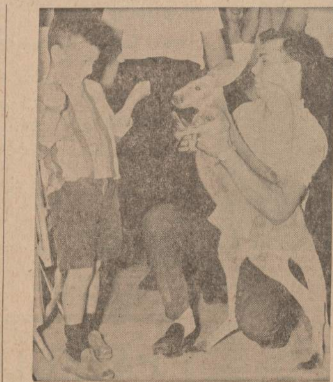
iš Detroito vaiku zoologinio sodo buvo pabėgęs ar pavogtas šėšiu mėnesiu kangaru Joey, kuris klaidžiojo visą dieną ir pagaliau įbėgo į Gettos laikomą krautuvę, kuri yra 13 mylių atstume nuo zoolo- gijos sodo.

Mokėsime nuo 1962 metų vasario 1 dienos Pinigai, idėti prieš mėnesio 15 d. duoda dividendus už visą mėnesį. Dividendai mokami sausio ir liepos 31 d. Prašome aplankyti naują mūsų namą. VALANDOS: Pirmad. ir ketvirt. 9:00 ryto — 8:30 vakaro; Antrad. ir penktadienį 9:00 ryto — 5:00 vakaro; Šeštadieniai 9:00 ryto — 12:00 dienos. Trečiadieniai uždaryta.