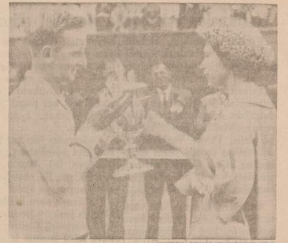
Anglijos karalienė Elžbieta Iteikia geriausiam teniso loškui australiečiui Rod Laver laimėtą trofėją. Teniso rungtynės vyko Wimbledon miestelyje, Anglijoje.