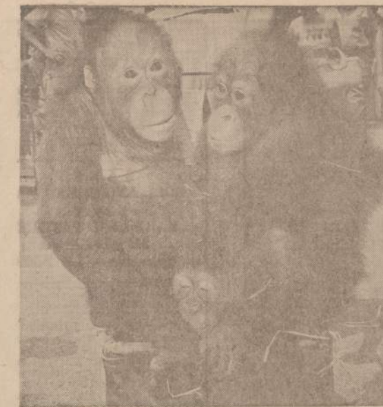
Chicago Brookfield zoologijos sode oranguono kūdikis perkeliama į vadinamąją vaikų salą. Tai mėgiamiausia vaikų lankytojų vieta.