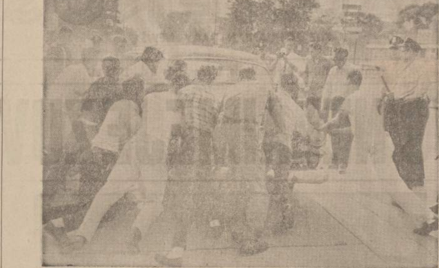
Roseville, Mich., miestelyje streikuoja Detroit Plastic Co. darbininkai. Paveiksle matome susikirtimą streikininkų su dirbtvės vadovybe vedė derybas su uni- ja, bet gegužio 29 dieną pasitarimai nutrūko.