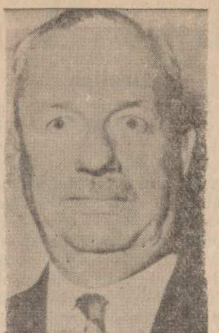
William R. Brunt, senato lyderio pavaduotojas, mirė nuo susižeidimo automobilio nelaimėje šio mėnesio pradžioje.