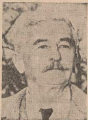
Garsus ir darbštas JAV rašytojas William Faulkner nuo širdies smūgio mirė savo namuose Oxford, Missisipi, miestelyje. Prieš kelis metus jis buvo gavęs Nobelio premiją. Ejo 64-tus metus.

ROMA. — Speciali komisija, ištyrusi Romos miesto medžių — pušų džiūvimo priežastis, nustatė, jog tie medžiai gaišta daugiausia dėl didelio kiekio oro esančių dujų (gazu). Komisija pasiūlė miesto valdybai griežtesnias priemones sumažinti oro teršimą, kurs susidaro dėl pramonės ir gyvenamųjų namų apkurenimo bei automobilių.