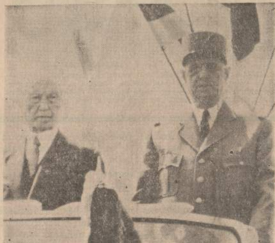
Vokietijos kancleris Konrad Adenauer (kairėje) ir Prancūzijos prezidentas Charles de Gaulle Reimso mieste drauge priima vokiečių ir prancūzų kariuomenės dalinių parodą — 300 šarvuotųjų ir 3,000 kareivių, demonstruojančių pasauliui šių dviejų tautų prisidėjusį draugingumą ir vienybę.