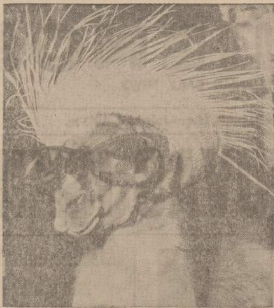
Peru kalnų gyvuliukas lama Palisades parke New Jersey dvi skrybėlės ir akinius visai ne dėl fasono, o dėl to, kad saulė perdaug kepina.

Įmonė taip slėpiama, kad nei kaimynystėje gyvenantieji nežino, kada atvyksta darbininkai, pro kur jie išvyksta. Net ir į valgyklą darbininkai patenka pro požeminį tunelį.