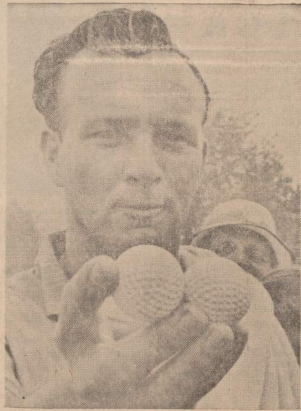
Golfininkas Arnold Palmer rodo du golfo kamuoliukus, vieną britišką, kitą amerikonišką. Prieš pradėdamas golfo turnamėtą, kurs įvyksta Aronimink, Georgia, liepos 19 diena, Palmer turi smarkiai pasipraktikuoti, nes amerikoniškas kamuoliukas yra šiek tiek didesnis už britiškąjį.

Jei dabar pažvelgti į kitas, partijos programoje žadamasias gerybes ar veiksmus, kurie siejami su gyvenimo lygiu, kaip nemokamas gydymas, ateityje žadamas nemokamas susisiekimas, ar gyventojų turimas gyvenamasis plotas, tai ir čia susidursime su Vakarų pranašumu. Nemokamas gydymas — kas iš jo, kai ligoninėse, vaistinėse trūksta pagrindinių vaistų? Nemokamas susisiekimas, vėl, geras daiktas, bet kur garantijos, kad jis bus patogus ar pakankamas (čia jau netenka kalbėti apie sovietinių piliečių slaptai puoseliamą norą važinėti savais automobiliais). Jei 1958 m. sovietiniams piliečiams gyvenamojo ploto teko vos 5,8 kv. metr., tai ir pakeltas plotas vargiai bus suderintas su moder-