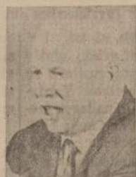
This man wants peace — but on his terms. One way we can help our government negotiate with him is to keep financially strong.

United States Savings Bonds are guaranteed to grow 33 1/3% bigger in 93 months. Start buying them today. Each one you sign up for will add that much more security to your country's future — and your own.