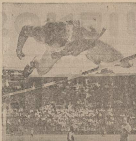
Rusas Valerij Brumel, pasaulinis čempionas šuolyje į aukštį, trenruojasi varžybos, kurios įvyks su amerikiečiais ši savaitgalį Palo Alto, Californijoje.

Artėjant nuo N. Zelandijos pakraščiu ligi ankstyvojo amerikinio sezono, kuris visada gausus pasaulio rek. ir iškilios pasaulinės klasės duomenimis, pirmiausiai garbė tenka Robert Hayes greitakojui, kuris 100 jardų nuotoly pakartoja pa-