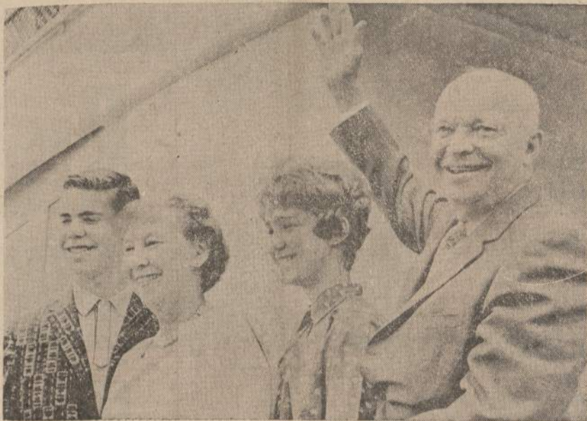
Buvęs prezidentas Dwight D. Eisenhoweris išvažiuoja į Europą, kur rengiasi paleisti vasaros atostogas. Kartu su juo išvažiuoja ponis Eisenhoweris ir du jo anūakai. Matome buvusį prezidentą "Queen Elizabeth" laive, atsiveikinantį su atlydėjusiais artimaisiais.

BARANQUILLA, Kolombija. — Čia įvyko riaušės dėl pakeliatobusų važmos kainos. Penki buvo sužeisti ir dešimt areštuota. Riaušės sukėlė studentai.