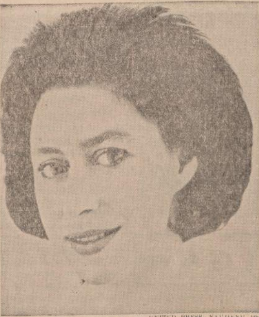
Princesė Margaret, dabartinė fotografo Anthony Armstrong Jones žmona, kurią vyras nufotografavo naujoje šukuosenoje ir apnuogintais pečiiais. Ji jau turi 9 mėnesių vaiką ir savo vyrui išrūpino "Lordo Snowden" titulą.