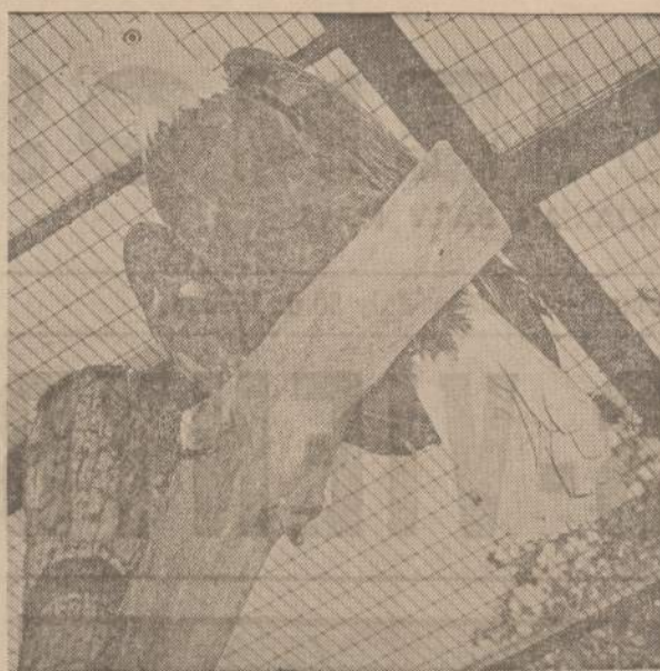
Amerikinis aras, kurį kongresmanas Sidney Yates iš Washingtono atsiuntė Linkolno zoologijos sodui Chicagoje, kur toks aras neseniai nugaikto. Tos veislės arai yra Amerikos krašto simbolis ir JAV valdžia juos labai globoja.

Mokinys: — Priklauso, ar žmogus yra vyras ar moteris.