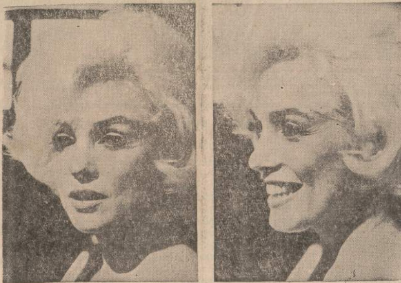
Marilyn Monroe, plačiai išgarsėjusi kino aktorė, buvo rasta negyva savo namuose, esančiuose Brentwood, Calif. Ji gulėjo lovoje, laikydama vienoje rankoje telefono ragelį. Mirė ji nuo per didelio miegamųjų vaistų kiekio. Šioje nuotraukoje Monroe parodoma, kai įjain vaidino "Something's Got to Give" filme.

KASABLANKA, Marokas. — Jordanijos karaliui Husseinui, atvykus su žmona iš Europos į Maroko miestą Tanžerą liepos 27 dieną, policija suėmė du sąmokslininkus, kurie prisipažino norėję karalių nužudyti. Abu sąmokslininkai buvo Palestinos arabai. Jie sekiojo karalių po Europą, ieškodami progos jį nužudyti, bet nerado. Į sąmokslą įveltas trečias asmuo, marokietis.