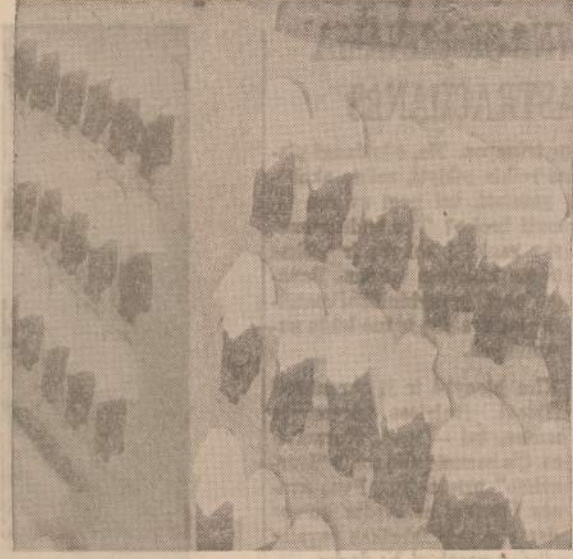
Trisdešimt aštuonios naujos vienuolės. Praleidusios vienuolių pareigas Notre Dame on The Lake, esančiame Mequon, Wis.

Mirė lietuvių bičiulis. Madride mirė buv. Ispanijos informacijos - turizmo ministras Gabriel Arias Salgado, kuris prieš 8 metus leido lietuviams naudotis Ispanijos Tautinio radijo siųstuvu, o neseniai pagilino lietuvišką programą iš Madrido 5 minut., žadėdamas dar prailginti iki 25-30 minučių. Ir šiaip jis rėmė lietuviškus reikalus.