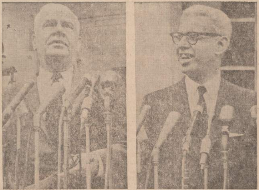
Prezidentas Kennedy tarėsi su prekybos sekretorium Luther Hodges (kairėje) ir darbo sekretorium Arthur Goldberg ryšium su sumažinimu pajamų mokesčių.